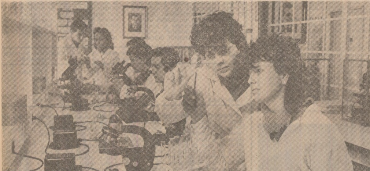
Institutul agronomic din Timisoara. Aici se pregătesc în acest an peste 1000 de studenți în două facultăți: Facultatea de zootehnie și medicină veterinară și Facultatea de agronomie.

Ceea ce nu înseamnă că rezultatele recenților examene îndeamnă în vreun fel sau altul la automulțumire. Nu numai pentru că o asemenea stare de spirit se refuză organice învățămîntului superior, ci și pentru că rezultatele globale, oricît de optimiste, nu pot acoperi în niciun fel minusculele, unele destul de frapante, din pregătirea unei părți a studenților. Așa cum am subliniat și cu alte prilejuri, pregătirea la cel mai înalt nivel a tuturor studenților este un imperativ deosebit de important și de necesar pentru activitatea universitară așeză, din perspectiva exercitării ei superioare, și în însăși condiția actuală a studenților de eretici, de factori ai progresului științifico-tehnic. Ca membru al unui cerc științific care-și propune sistematic abordarea aspectelor majore din câmpul specialității, ca participant într-un colectiv mixt, interdisciplinar de cercetare pe bază de contract economic sau ca practicant într-un atelier de instruire, într-un birou de proiectare, cu sarcini tehnico-economice precise, fiecare student se bucură de o încredere considerabilă care, firesc, se cere onorată printr-o investiție de muncă, de inteligență, de creație meritorie. Nici un student nu-și poate permite să nu aibă o pregătire meritorie, necum una slabă, cînd știe că nu numai după absolvirea facultății, ci chiar astăzi, efortul lui de pregătire lasă urmări adînci în activitatea de zi cu zi, activitate consacrată deopotrivă însușirii și producerii de valori materiale și spirituale.