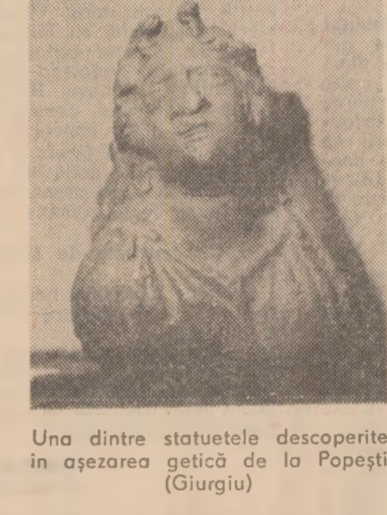
Una dintre statuetele descoperite în așezarea getică de la Poștea (Giurgiu)