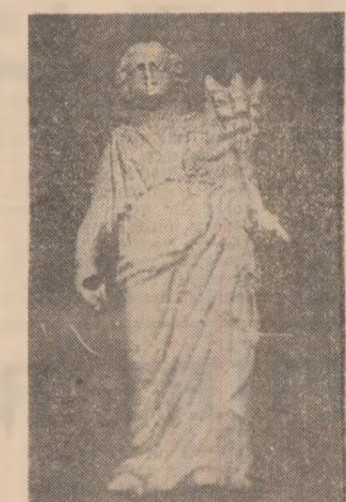
Statuetă de bronz descoperită în castrul roman de la Micia (Velje), județul Hunedoara