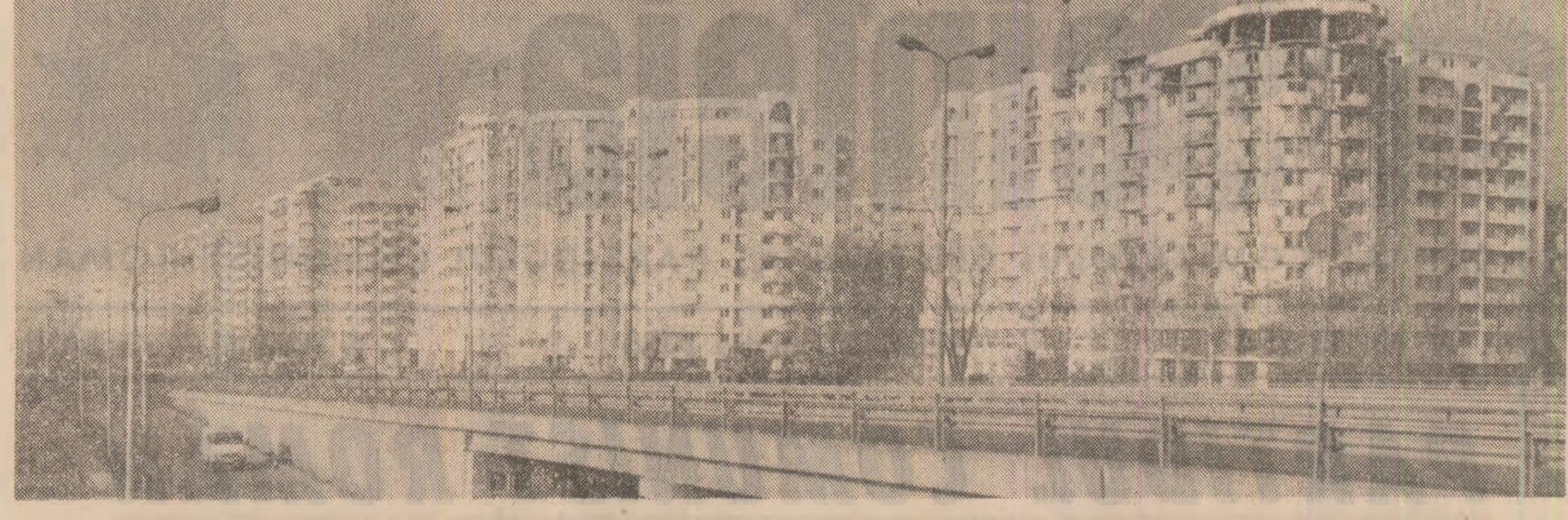
Imagine de pe șoseaua Cringăși din Capitală