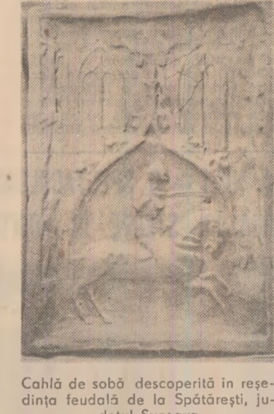
Chihă de sobă descoperită în reședința feudala de la Spătărești, județul Suceava