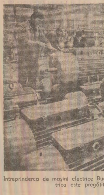
Întreprinderea de mașini electrice București: un nou lot de motoare electrice este pregătit pentru expediție