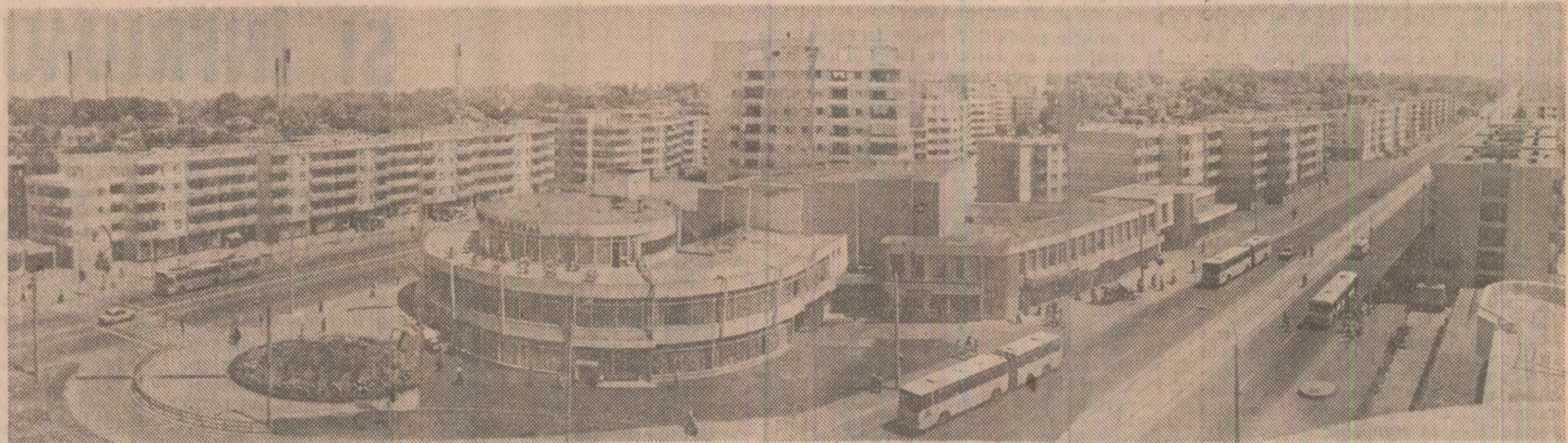
Din noua arhitectură a municipiului Constanța

Rodica ȘERBAN (Continuare în pag. a V-a)