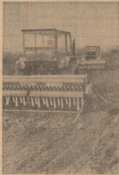
La însămîntări, pe terenurile C.A.P. Vereș, județul Caraș-Severin

Controlul permanent asupra modului în care se aplică măsurile pentru scurtarea timpului de semănat și executarea unor lucrări de cea mai bună calitate, rezolvarea promptă a tuturor problemelor ce apar, stimularea inițiativelor, a muncii mecanizatorilor și celorlalți lucrători — iată preocupări de cea mai stringentă actualitate și importanță a organizațiilor de partid de la sate.