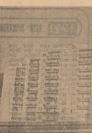
Noi construcții de locuințe în cartierul „Grigorescu” din municipiul Cluj-Napoca