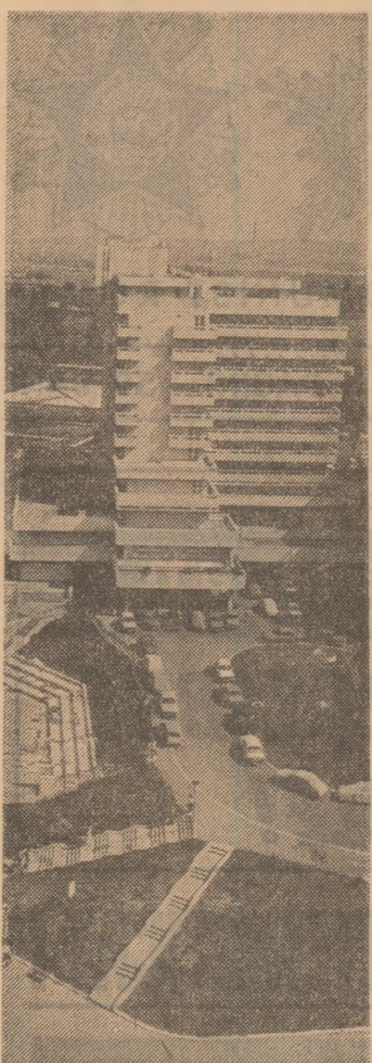
vedere din stațiunea Felix — Oradea