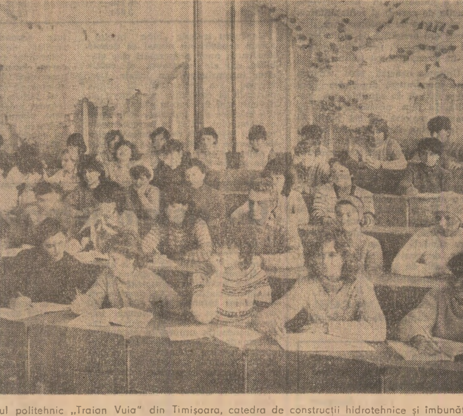
Ore de curs la Institutul politehnic „Traian Vuicu” din Timișoara, catedra de construcții hidrotehnice și îmbunătățiri funcționare.