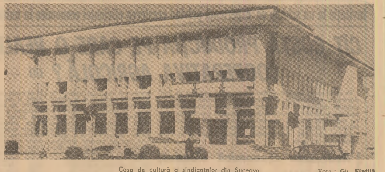
Casa de cultură a sindicatelor din Suceava

Pentru prima dată în istoria României, rostul investițiilor în viața economică-socială a țării s-a făcut în conformitate cu un plan bine gândit de dezvoltare a țării. Drept urmare — se precizează în lucrarea amintită — „nu au asigurat acea necesară unitate a sistemului economiei naționale.”