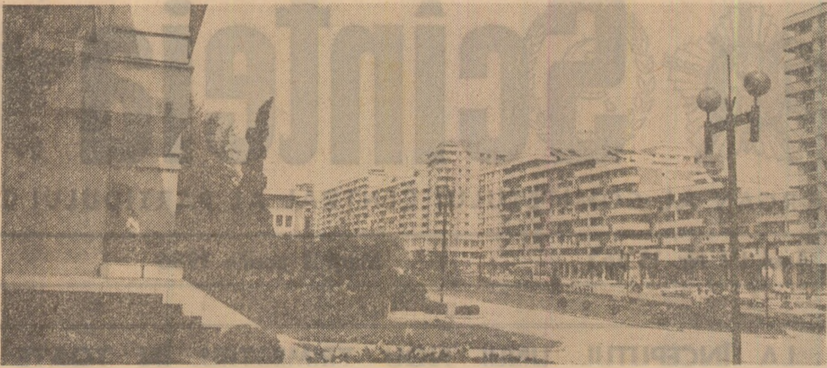
Urbanistică modernă la Pitești.

Fabrica de utilaj complex din Ploiești este bine cunoscută în țară prin produsele pe care le realizează: utilaje tehnologice, compensoare de diverse tipuri, instalații de apă gaură, construcții pentru foraj maritim, rezervoare de presiune etc. Datorită prestigiului dobîndit, acestui colectiv i s-a încredințat sarcina ca, începînd din acest an, să producă în colaborare cu întreprinderea „I. Mai” utilaj pentru export. Trecură de la producția de utilaj tehnologic la cea de subsam-