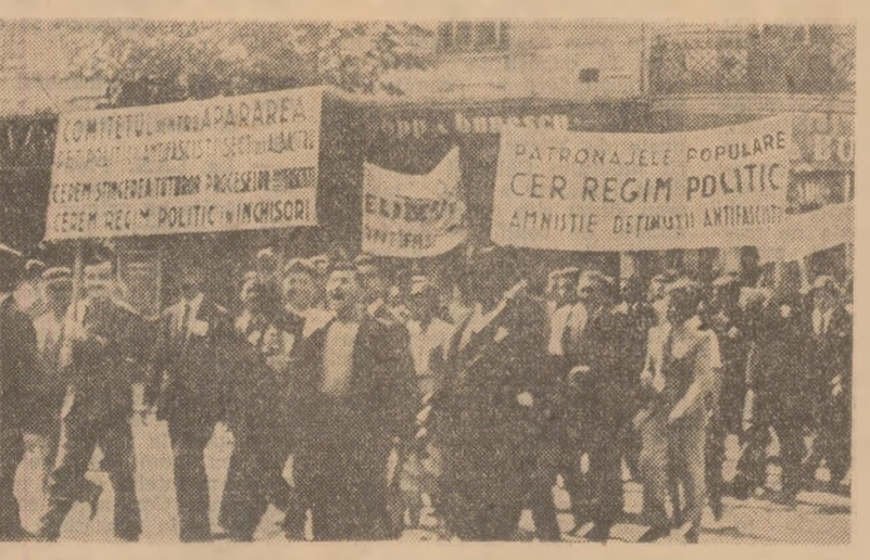
Aspect de la marea demonstrație din Capitală de la 31 mai 1936, în cadrul căreia s-a cerut instaurarea regimului politic în închisori

sprîn și solidaritate din afara închisorii, partidul mobilizând în acest scop mase largi populare, opinia publică democratică din țară, ca și de peste hotare.