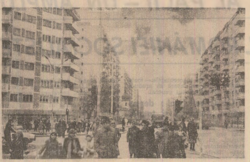
Construcții moderne la Focșani