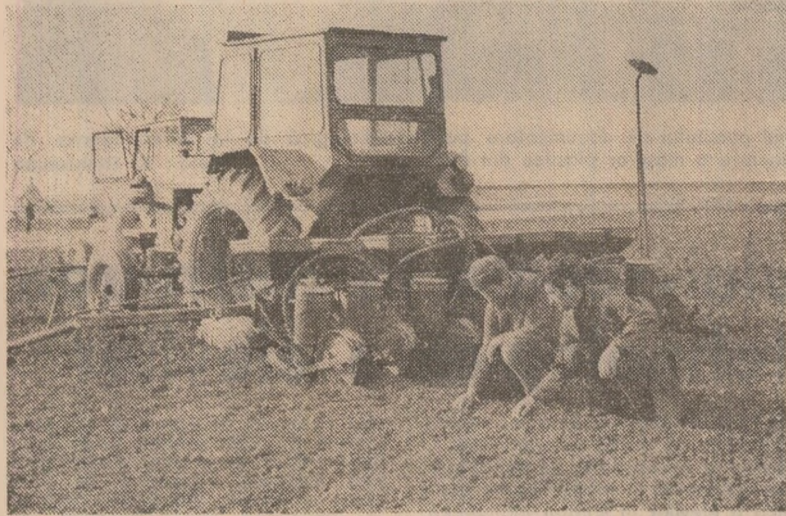
La cooperativa agricolă Brîncoveni, județul Olț, calitatea însămînțirilor este controlată îndeaproape

...In numai cîteva zile însoțite, cîmpurile Olțului au capatat culoarea verdei crud, prevenind un început bun al acestui an agricol.