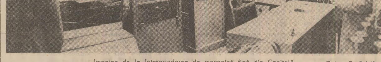
Imagine de la întreprinderea de mecanică fină din Capitală

În unitățile agricole din județul Sălaj se folosesc utilaje perfecționate pe plan local.