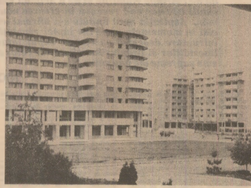
Din noua arhitectură o Brăilei