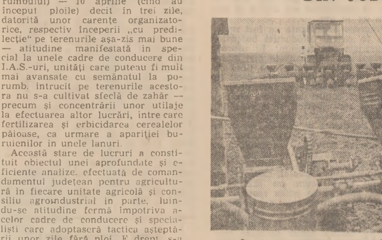
Semănatul porumbului la I.A.S. Bechieru Mic, județul Timiș