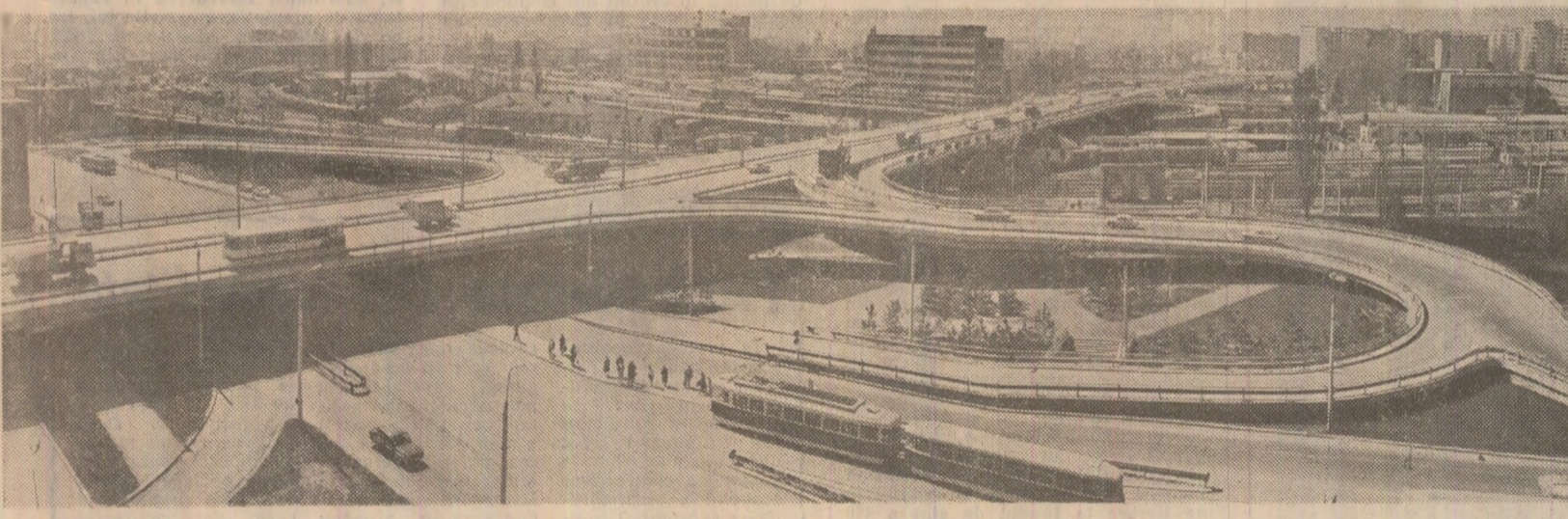
Podul Grant din Capitala