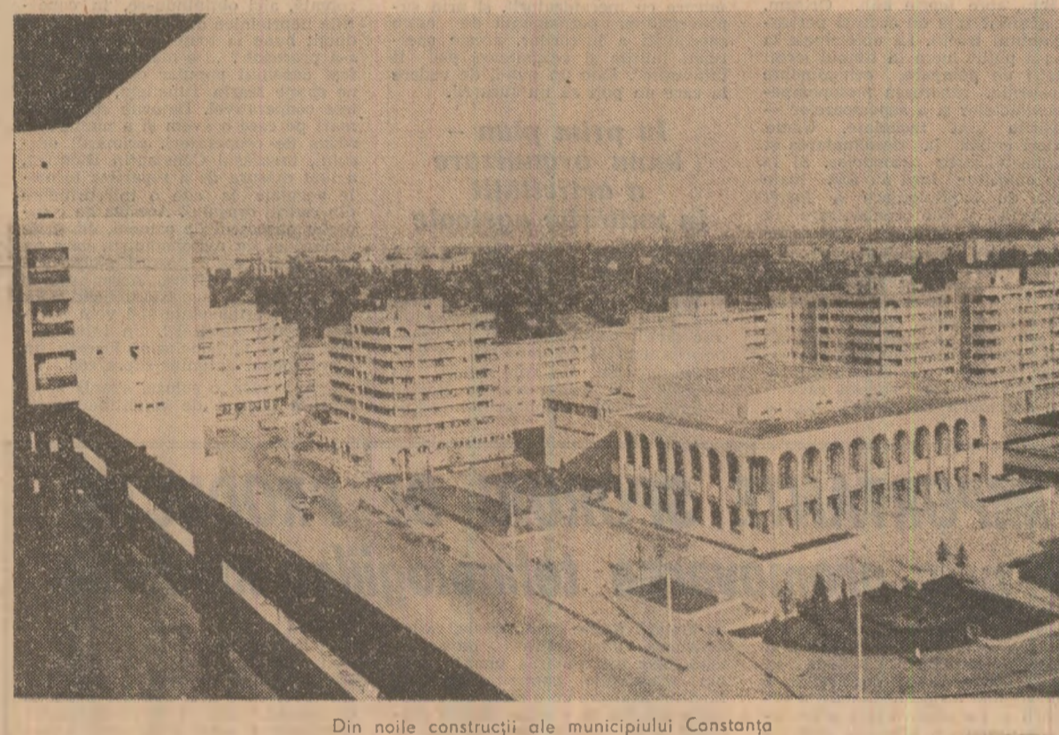
Dim noile construcții ale municipiului Constanța