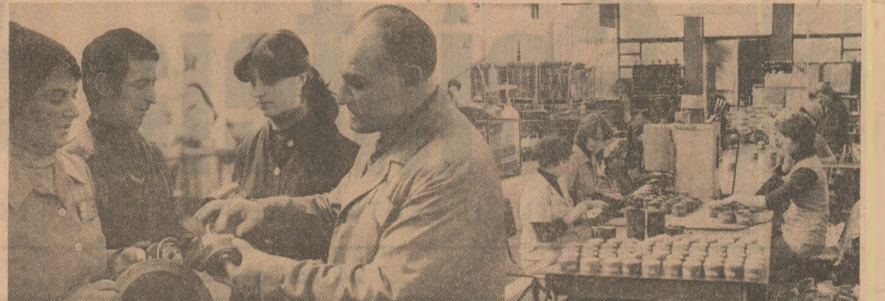
La întreprinderea de prelucrare a maselor plastice Buzău a intrat în fabricație un nou produs pentru export: filtrele de ulei și aer pentru autoturisme și camioane.

Gheorghe BALTA correspondentul „Științei”