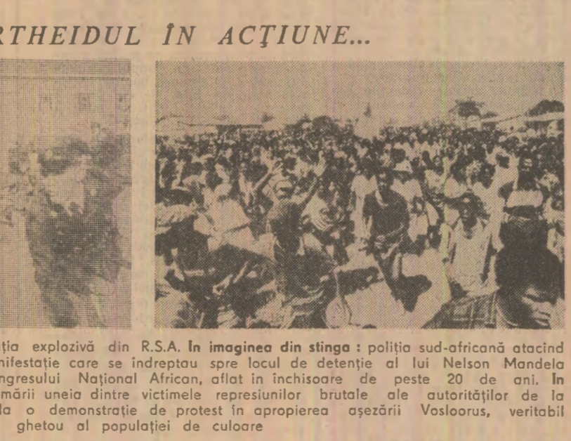
Doi secvențe sugestive pentru situația explozivă din R.S.A. În imaginea din stînga: poliția sud-africană atacînd cu sălbăticie pe participanții la o manifestație...