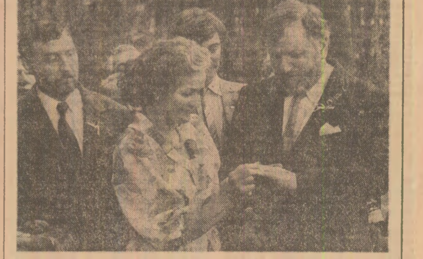
6 mai 1986: DRAGOSTEA CU PARFUM DE RAȘINA — regia: Jiri Hanibal — spectacol de gală.