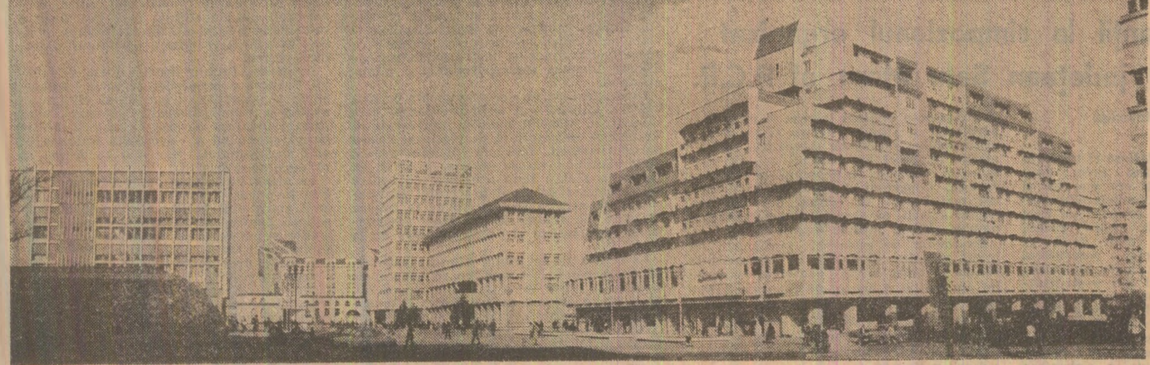
Mărețe și luminoase zidiri purtînd emblema epocii noastre — „Epoca Nicolae Ceaușescu” — au întinerit localitățile patriei. În imagine — noul centru al municipiului Tîrgoviște.