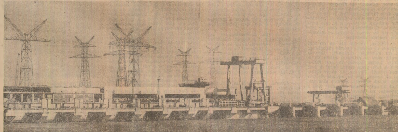
Porţile de Fier II — o nouă constelaţie de lumină în salba de hidrocentrale a ţării

magistrală sa cuvîntare, concluzia că, acţionînd unit, punînd la baza luptei lor spiritul revoluţionar, comunistii, toţi fiţii ţării vor asigura întotdeauna mersul înainte al societăţii, poporul însuşi fiind în orice împrejurare de neînfrînt, mereu victorios, asigurînd înfăptuirea exemplară a programului de faurire a societăţii socialiste multilaterale dezvoltate, de înălţare a României pe noi cîmşi de progres şi civilizaţie.