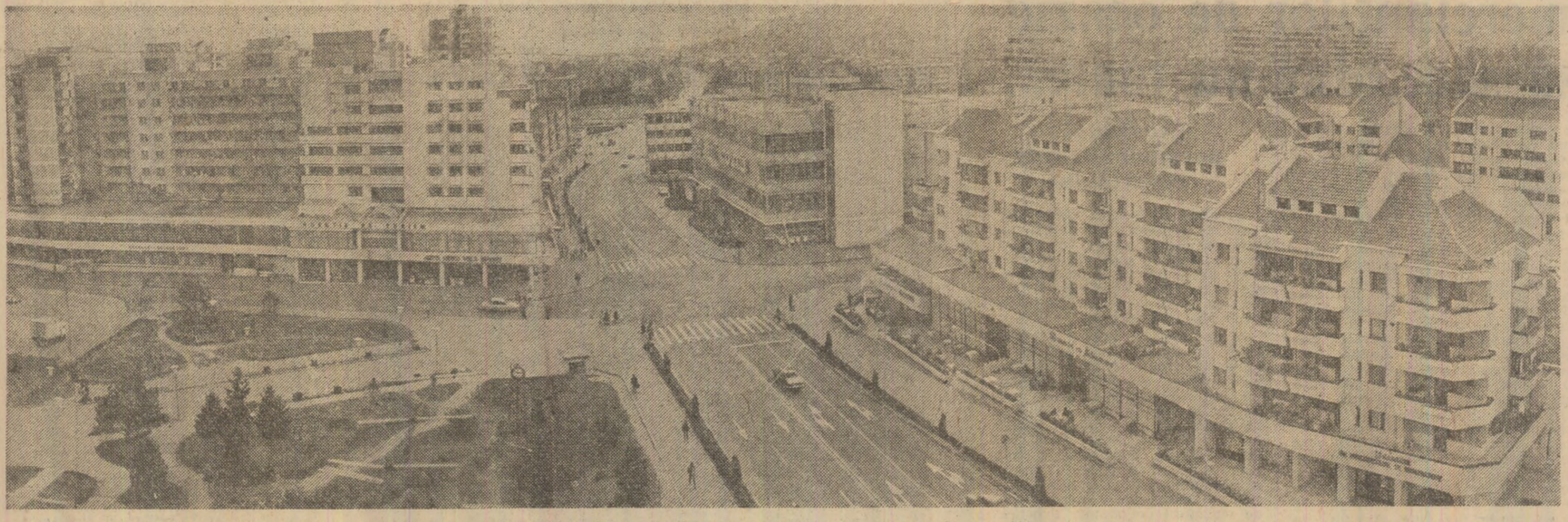
Ansamblu arhitectonic din zona centrală a municipiului Rîșnicu Vilcea

În cadrul programului pentru autoutilare, la Întreprinderea mecanică de material rulant din Pașcani a fost realizată cu foarte procliv o mașină-agregat pentru știeptarea tamponelor de vagoane. Este o mașină de mare capacitate, care conduce la creșterea productivității muncii cu 180 la sută. Înainte, operația de sudură se executa semiautomat pe știeptarea tamponelor se făcea automat, sub strat de flux. Mașina-agregat pentru sudura tamponelor este universală, putînd funcționa și în mediu protector cu oxid de carbon. Totodată, este compusă din instalații de ridicat și coborît tamponelor, înainte și după operația de sudură, ceea ce ușurează mult munca oamenilor. Punerea în funcțiune a noii mașini-agregat de ridicat conduce la economii anuale de peste 700 000 lei, ca urmare a creșterii productivității muncii, a reducerii timpului de lucru și a consumului energetic. (Marian Corcaci, corespondentul „Științei”).