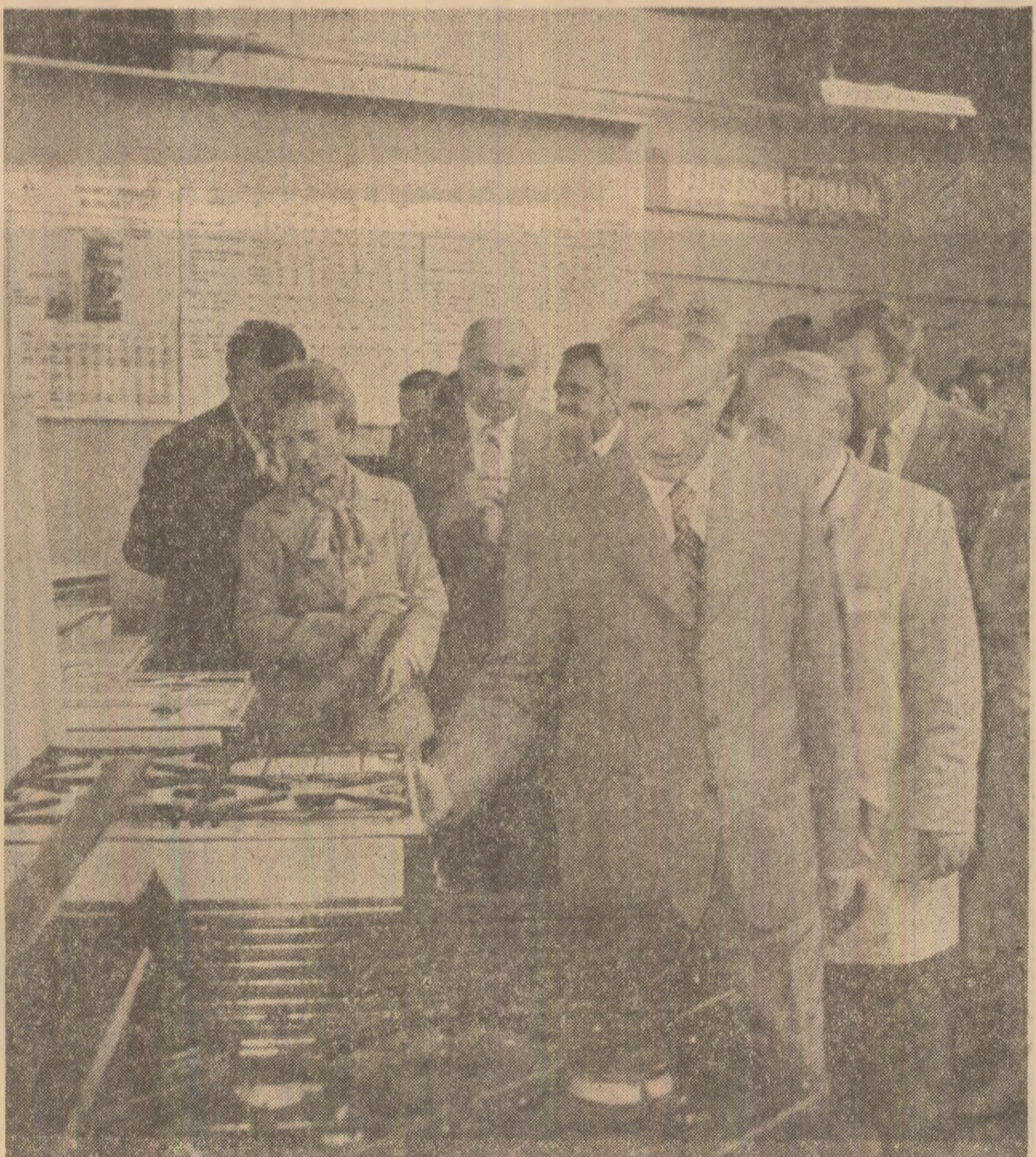
La întreprinderea „23 August” din Satu Mare