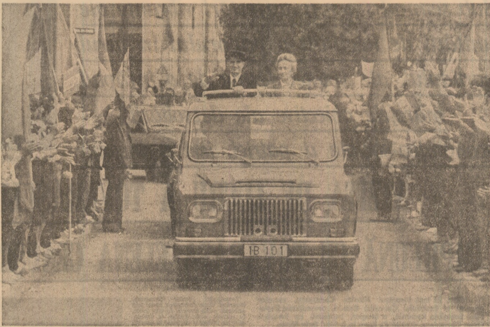
Primire entuziastă, aplauze și ovajii ale populației din Carei

În continuare, elicopterul prezidențial a aterizat în orașul Negrești-Oas. Întreaga evoluție dinamică a localității este indisolubil legată de numele conducătorului partidului și al țării, tovarășul Nicolae Ceaușescu. Încă de la prima sa vizită, aici, în toamna anului 1965, s-au pus bazele industriei. De-a lungul anilor, a prins contur și s-a dezvoltat o puternică platformă industrială, cu întreprinderi moderne și mii de muncitori. Edificator în această privință este faptul că producția-marfă industrială a crescut de la 17 milioane lei în 1965, la peste 1,3 miliarde lei în