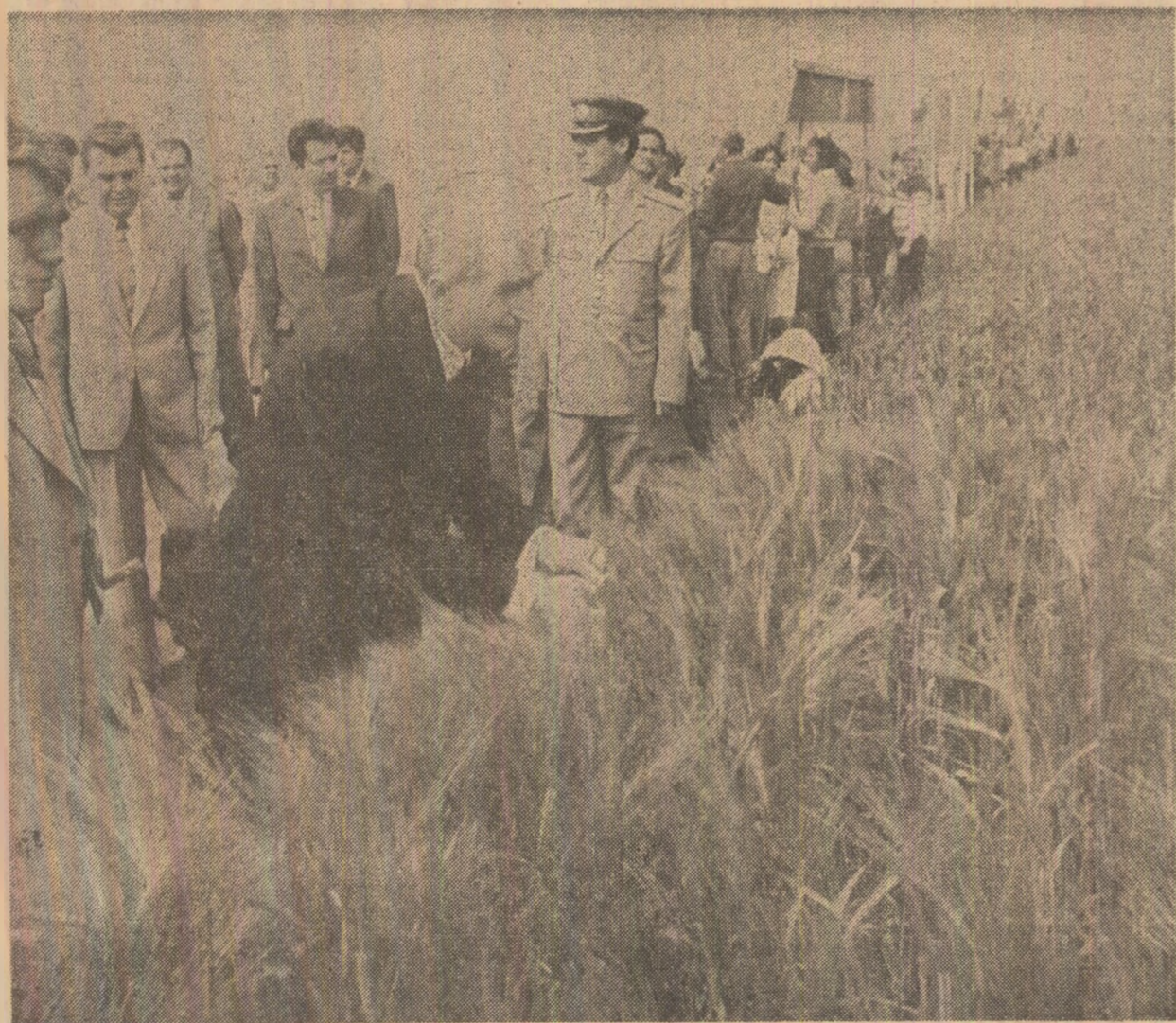
La cooperativa agricolă de producție Sanislău, se examinează stadiul vîltoarei recolte