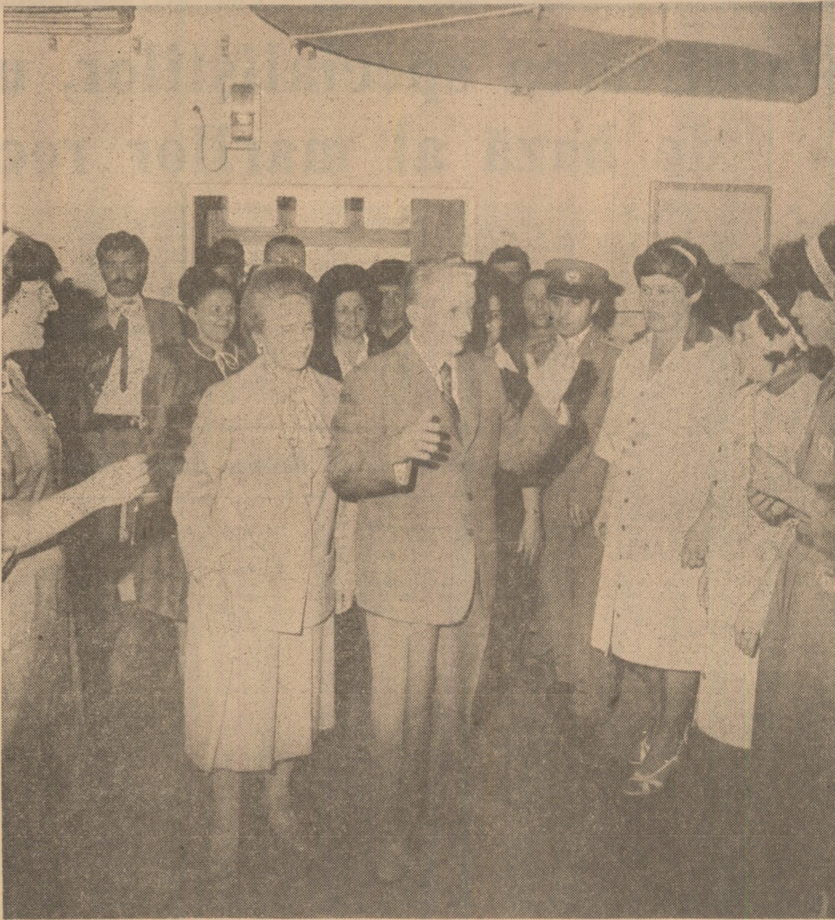
În timpul vizitei la întreprinderea de confecții „Mondiala” din Satu Mare