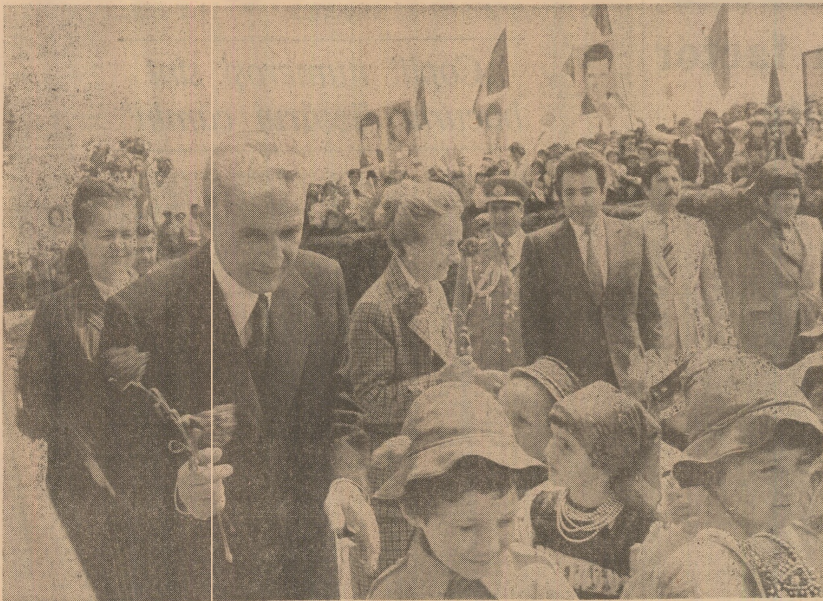
Sentimente calde, de profundă dragoste și recunoștință