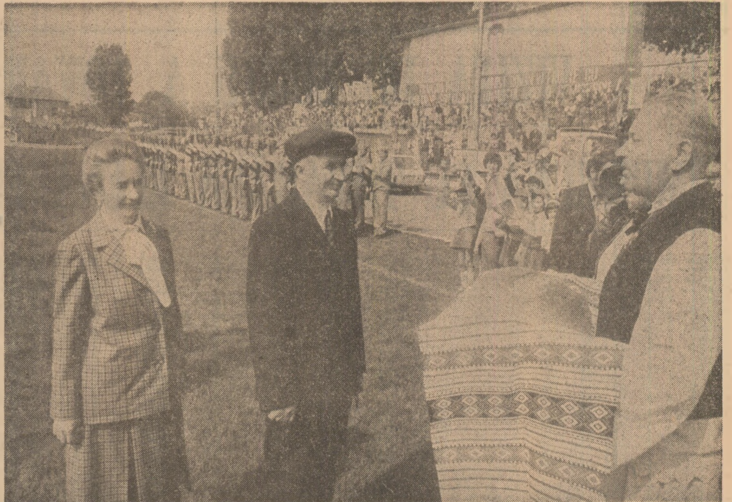
Tovarășul Nicolae Ceaușescu și tovarășa Elena Ceaușescu sînt întâmpinați pretutindeni cu manifestări de deosebit respect și înaltă considerație