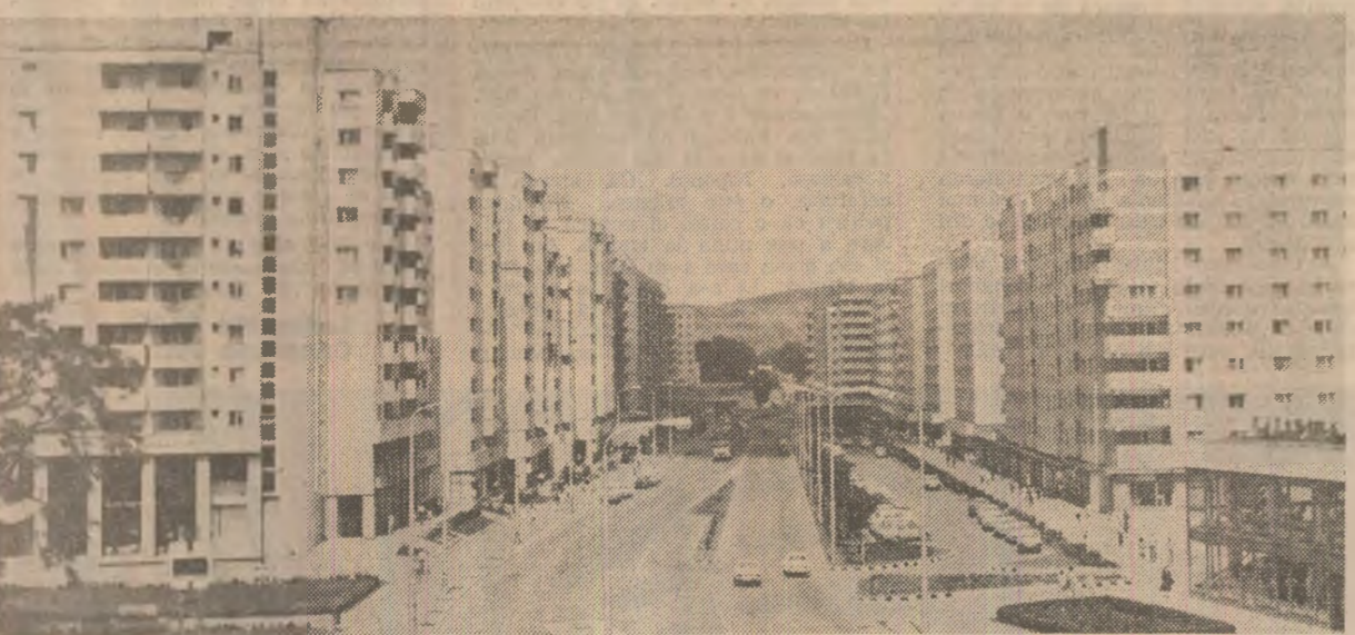
Din noile construcții ale municipiului Zolota

Ne aflăm în începutul celui de-al 8-lea plan cincinal, care marchează o nouă etapă de dezvoltare economică și socială a țării. Obiectivul strategic fundamental al noului cincinal este trecerea, pînă în 1990, a României de la stadiul de țară în curs de dezvoltare la un stadiu superior, de țară mediu dezvoltată. Înălțarea acestor obiective impune, așa cum sublinia tovarășul Nicolae Ceaușescu în cuvîntarea rostită la adunarea solemnă prilejului de aniversare a partidului, creșterea dezvoltării intensive a industriei, agriculturii, a celor-