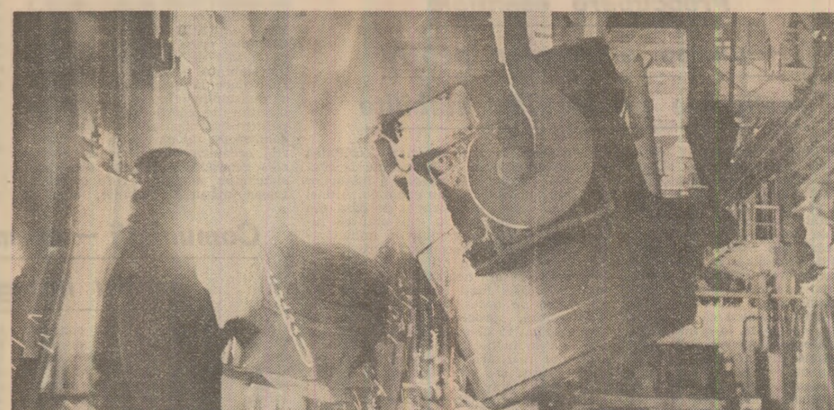
La Combinatul siderurgic din Reșița, în secția otelărie se elaborează noi șarje de oteluri aliate, cu calități superioare, necesare construcțiilor de mașini.

Urez tinerilor prieteni din China și România să se unească tot mai strîns, să progreseze tot mai mult!