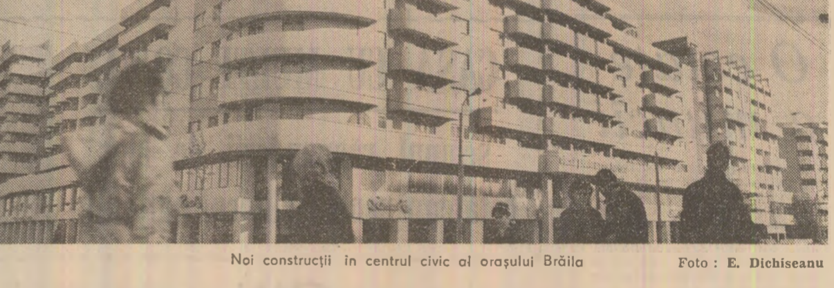
Noi construcții în centrul civic al orașului Brăila.