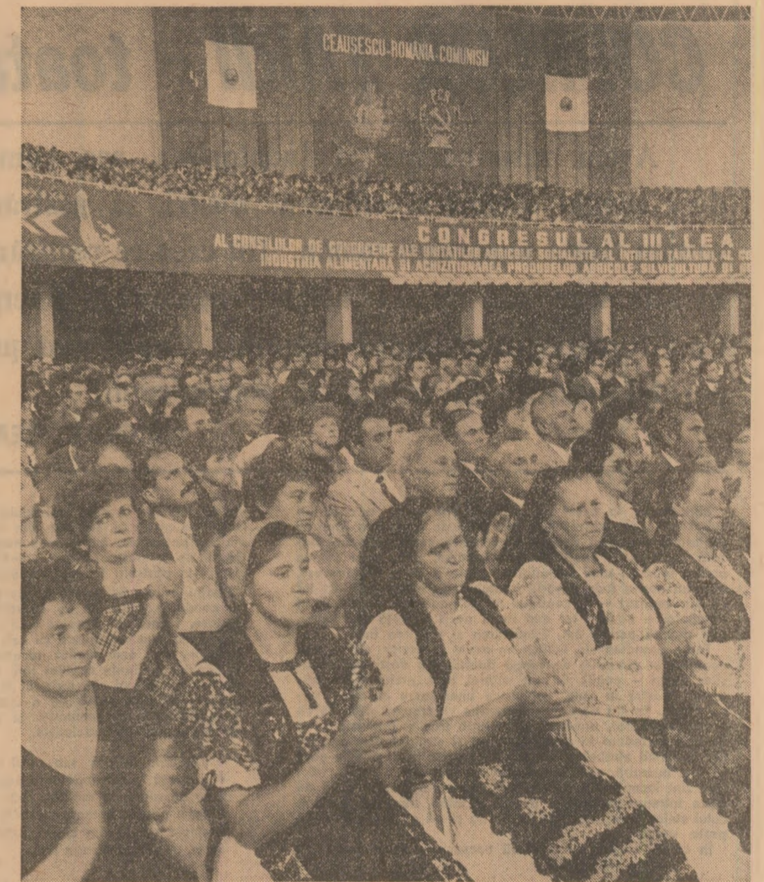
materializeze la toamnă în producții cit mai bune. De altfel, lucrările pe care le-am realizat în acest an sunt deosebit de calitative superioare anilor precedenți, ceea ce ne întărește convingerea că în 1986 vom obține producții medii cel puțin la nivelul prevederilor de plan.

În vederea realizării necesarului de furaje, întregul suprafață de livezi clasice a fost înșămînțată cu plante de nutreț, obținîndu-se, în medie, peste 3 500 kg fin la hectar, fără să fie afectată producția de fructe. Am acționat pentru extinderea leguminoaselor, a