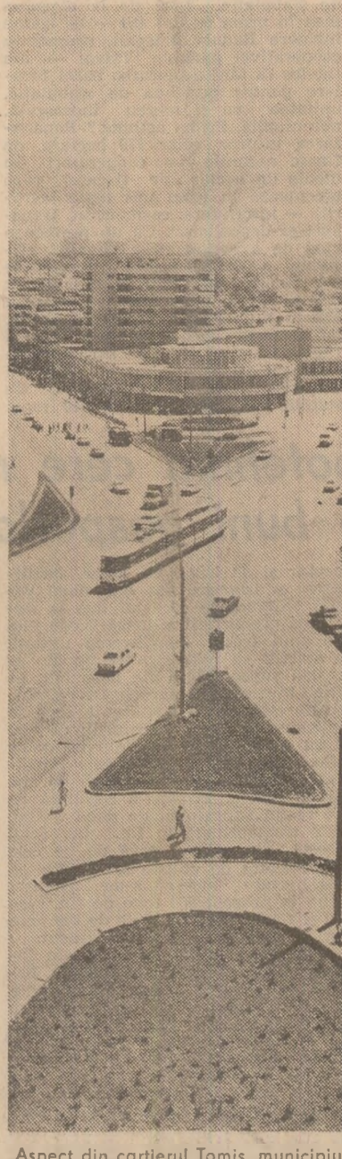
Aspect din cartierul Tomis, municipiul Constanta