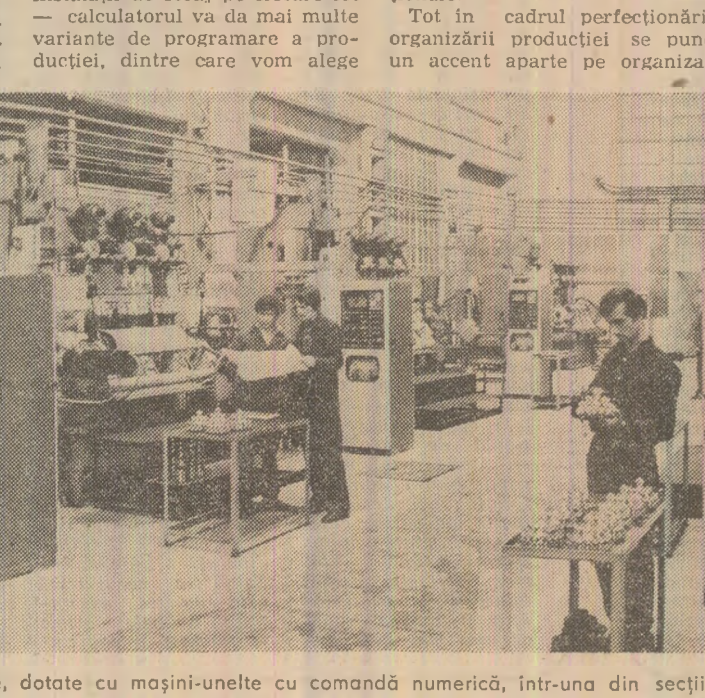
Linii tehnologice moderne, dotate cu mașini-unelte cu comandă numerică, într-una din secțiile fabricii de sape de foraj

— După cum vedeți, obiectivul de a crește producția de sape de foraj cu role de cinci ori este realizat în proporție de 80-90 la sută cu mașini-unelte cu comandă numerică; transportul interetajelor și de semifabricate este mecanizat, iar spațiul de lucru este dotat cu tehnologii noi, precum și cu echipamente de măsură și control.