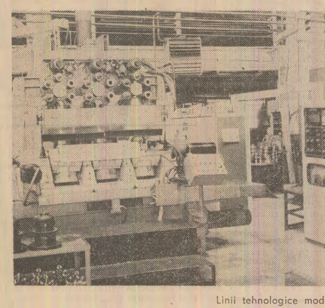
Linii tehnologice moderne, dotate cu mașini-unelte cu comandă numerică, într-una din secțiile fabricii de sape de foraj

Desigur, așa cum arătam mai înainte, o asemenea acțiune de anvergură, cu implicații prof-