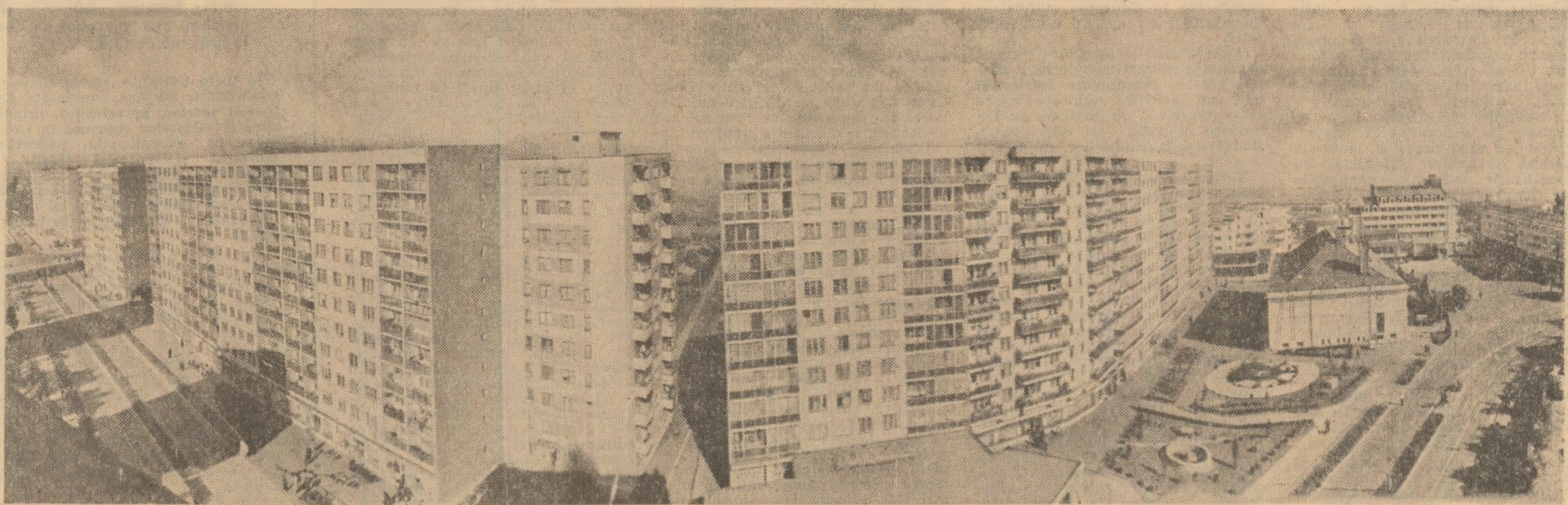
Orașul Pașcani devine an de an mai frumos, mai înfloritor prin grija edililor și locuitorilor săi