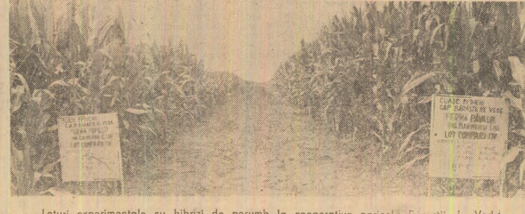
Loturi experimentale cu hibridi de porumb la cooperativa agricolă Dărăști J. Vede