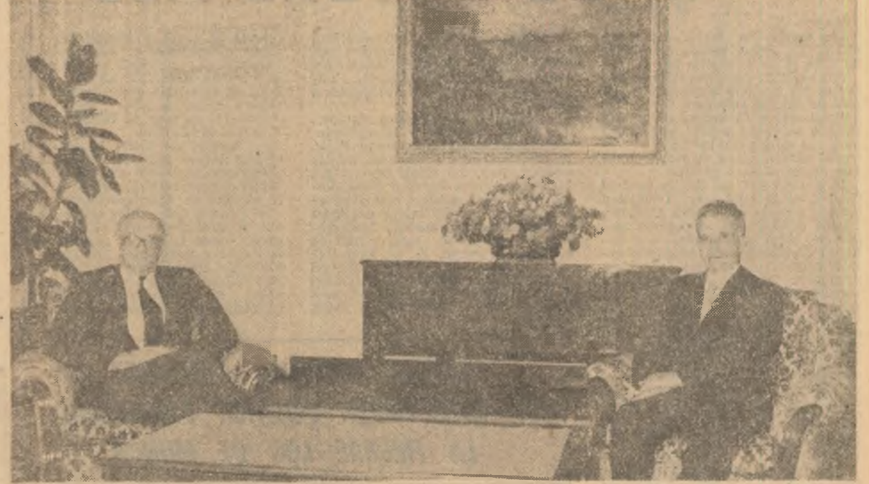
Tovarășul Nicolae Ceaușescu, secretar general al Partidului Comunist Român...