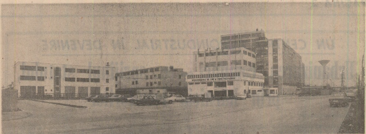
Din noul peisaj industrial al orașului Roman, județul Neamț: Întreprinderea de fire și fibre poliamidice.

Anul LV Nr. 13 671 Miercuri 6 august 1986 Prima ediție 6 PAGINI — 50 BANI