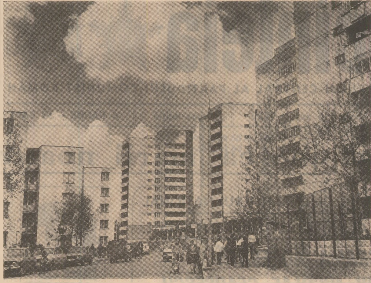
Noi construcții de locuințe în Codorheii Secuiesc

Pentru că vitorul centru agroindustrial se înalță dintr-o lină și mai substanțial al statului, prin munca, harnicită și competența locuitorilor! C. BORDEIANU