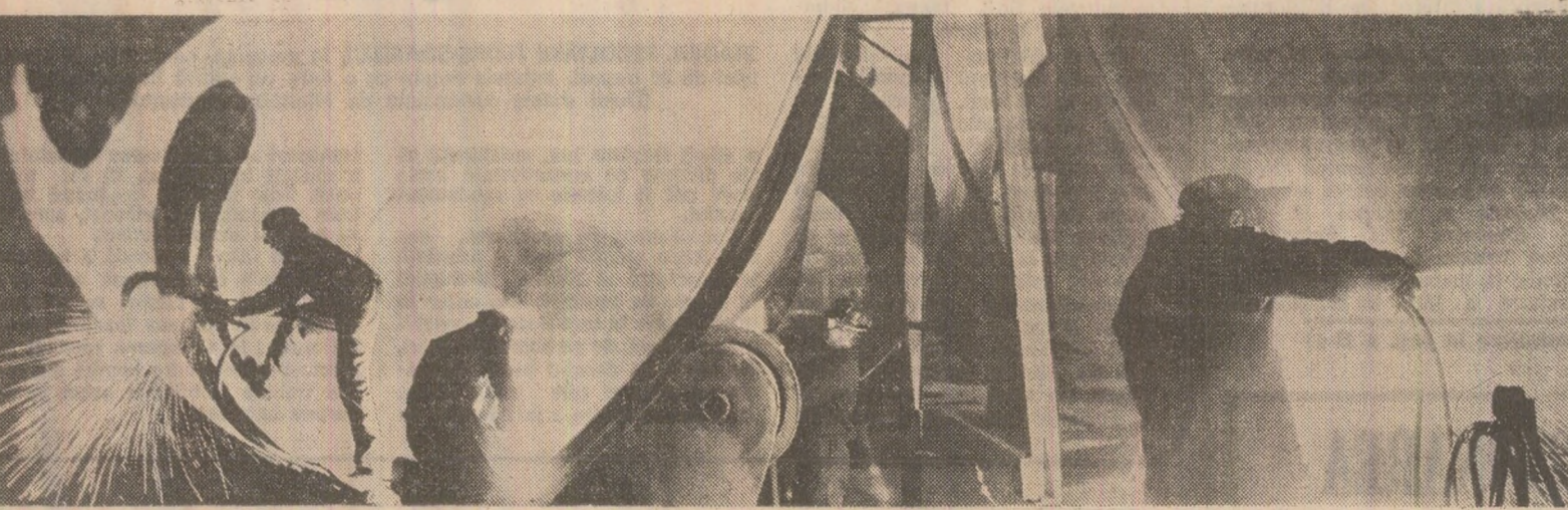
Situându-se printre colectivele fruntase în întrecerea socialistă, oamenii muncii de la întreprinderea de utilaj chimic „Grivița roșie” din Capitală desfășoară în aceste zile o activitate intensă pentru îndeplinirea în cel mai bun condiții a sarcinilor de plan pe luna august. În fotografie: aspect de muncă din secția cazangerie.

Relevând pe larg problematica dezbătută în cadrul adunărilor generale ale oamenilor muncii, conferințele județene au analizat, de asemenea, în spiritul exigențelor formulate de secretarul general al partidului pentru acest prim an al noului cîminal, modul cum se acționează pentru îndeplinirea în cele mai bune condiții a planurilor și programelor aprobate de plenaryle C.C. al P.C.R. în direcția perfecționării organizării și modernizării proceselor de producție, a pregătirii profesionale a tuturor oamenilor muncii, realizării ritmice și integrale a planului la producția fizică, realizării integrale, la termenele prevăzute în contracte și de cea mai bună calitate a producției pentru export, ridicării nivelului tehnic și calitativ al produselor, creșterii productivității muncii, realizării unei eficiențe economice superioare în toate sectoarele de activitate. În acest context, au fost scoase în evidență preocupările consilierilor oamenilor muncii pentru creșterea condițiilor optime în vederea îndeplinirii acestor obiective de o deosebită însemnătate pentru progresul economico-social al țării, pentru dezvoltarea continuă a avuției naționale și apărarea cu fermitate a proprietății socialiste.