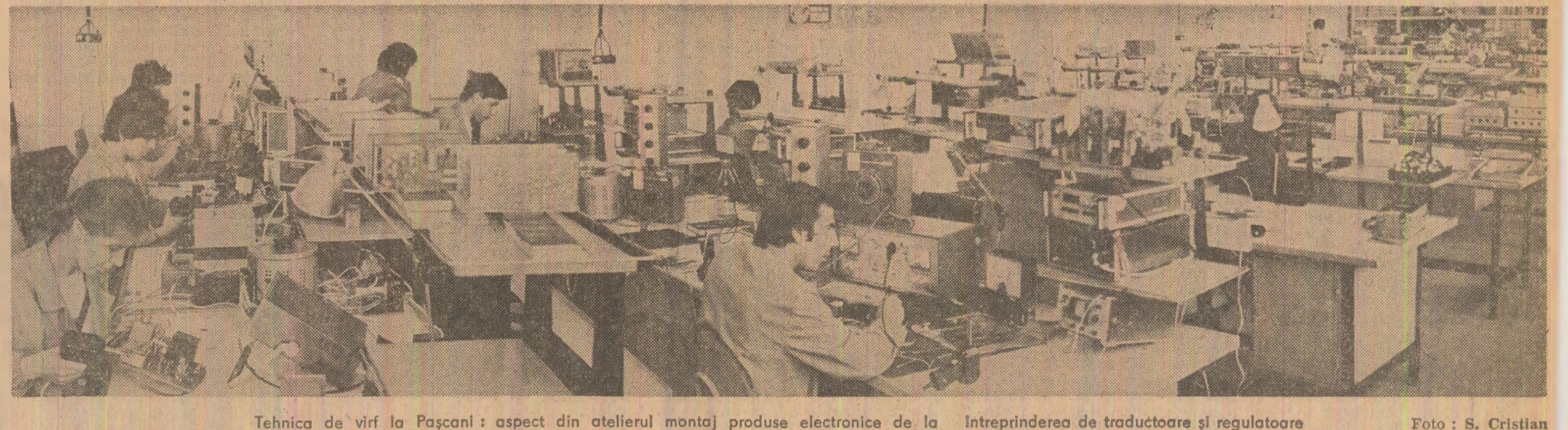
Tehnica de vîrf la Pașcani : aspect din atelierul montaj produse electronice de la întreprinderea de tractoare și reglatoare

fost depășit cu 19 500 lei pe fiecare lucrător. În același timp, volumul mărfurilor livrate partenerilor externi este mai mare cu 47 la suta comparativ cu cel realizat în prima jumătate a anului 1985. (Ioan Marinescu)