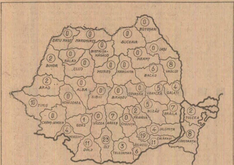
STADIUL RECOLTĂRII PORUMBULUI. În procente, pe județe, în seara zilei de 28 august. (Date furnizate de Ministerul Agriculturii)

Cum se aplică în practică principiile autoconducerii și autogestunii? Ce experiențe deosebite se pot desprinde, ce probleme se ridică în activitatea de zi cu zi, cum poate fi îmbunătățită activitatea economico-financiară și ce perfecționări pot fi aduse mecanismului economico-financiar? Cum poate fi scurtat ciclul producție — marfă — bani? Sînt întrebări care au stat în atenția participanților la dezbaterile organizată de ziarul „Știința”, cu sprijinul Comitetului județean Bihor al P.C.R., pe tema răspunderii organelor de conducere colectivă pentru aplicarea cu eficiență superioară a principiilor noului mecanism economico-financiar. Opiniile acestor dezbateri sînt prezentate în pagina a III-a a ziarului.