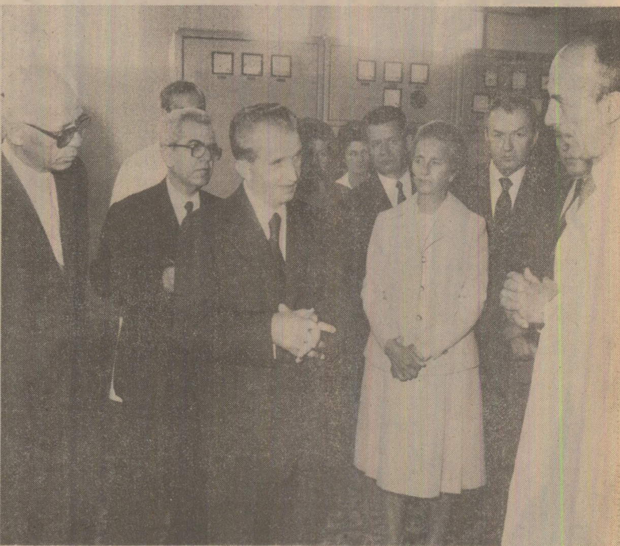
În timpul vizitei la întreprinderea de utilaj chimic „Orvita Roșie” și la Facultatea de electrotehnică a Institutului politehnic