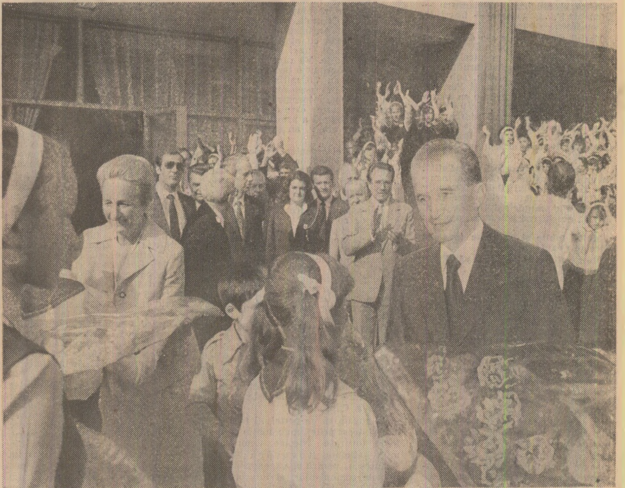
Flori ale dragostei, flori ale recunoștinței

Într-o atmosferă de puternică însuflețire și strînsă unitate, toți cei prezenți la marea adunare populară aplaudă și ovaționează, cu deosebită căldură, pentru Partidul Comunist Român — forța politică conducătoare a întregii națiuni — pentru secretarul general al partidului, președintele Republicii, tovarășul Nicolae Ceaușescu.