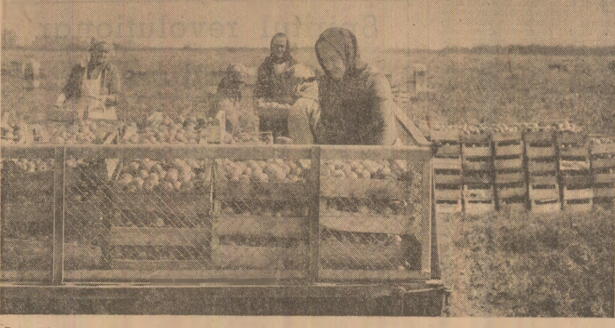
Din grădina cooperativei agricole Cuzdriuroa, județul Cluj, continuă să se livreze cantități apreciabile de legume; dar culesul și transportul trebuie mult intensificate, aici aflîndu-se cantități mari de produse

Mai există un volum mare de lucrări, fapt ce necesită o concentrare deosebită de forțe, astfel încît toate capacitățile energetice să fie pregătite corespunzător pentru sezonul rece. Desigur, acești impozabile cerințe trebuie să se supordoneze eforturilor, atît ale energieticienilor din centralele electrice, cît și ale colectivelor din unitățile din industria construcțiilor de mașini, care trebuie să asigure livrarea integrală a pieselor de schimb prevăzute. Ion LAZAR