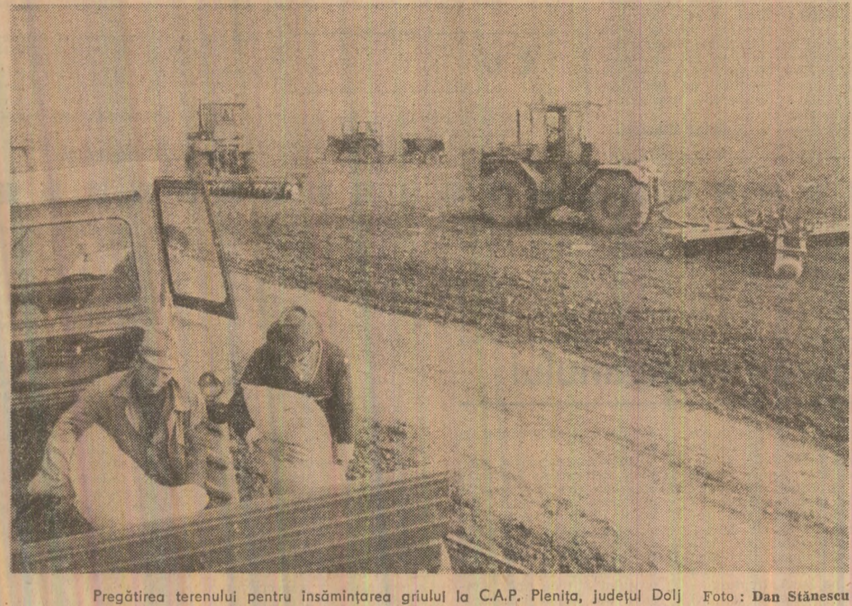
Pregătirea terenului pentru însămînțarea grîului la C.A.P. Pleșița, județul Dolj.