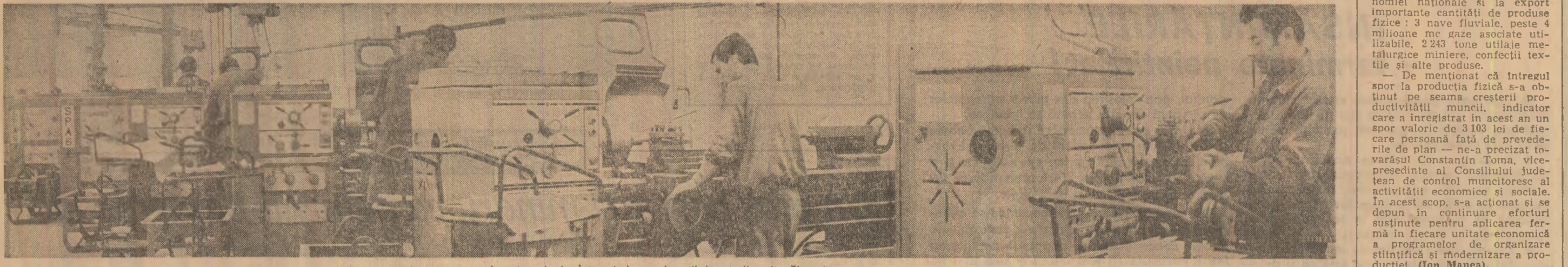
Imagine de la întreprinderea de utilaj petrolifer din Tîrgoviște

• Să se înlătuiească integral programele de măsuri prevăzute la fiecare centrală electrică pentru funcționarea la capacitate a sistemului energetic în perioada sezonului rece.