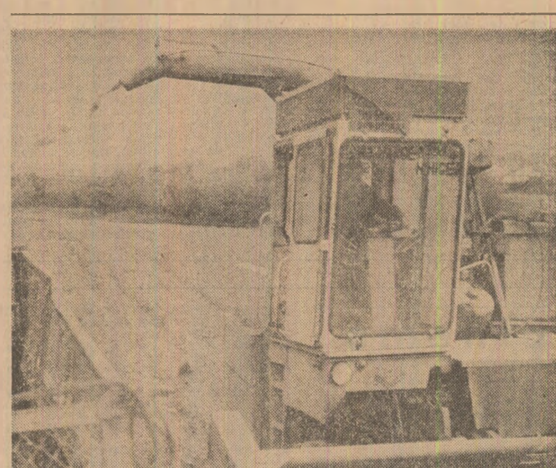
În unitățile agricole din județul Bistrița-Năsăud continuă stringerea și depozitarea furajelor pentru perioada de stabulație. În depozitele fermelor zootehnice ale unităților agricole socialiste se află stocate 86 la sută din cantitățile prevăzute de fin, 51 la sută din suculetele și 42 la sută din grosiere. Cu rezultate peste media județului se înscriu consiliile agroindustriale Simbui, Orhei, Bistrița și Lechința. Intrucît cîmpul oferă încă destule resurse de furaje, continuă stringerea și insulozarea lor. (Gheorghie Crișan) În fotografie: recoltarea furajelor la cooperativa agricolă Nimiea în vederea insulozării.