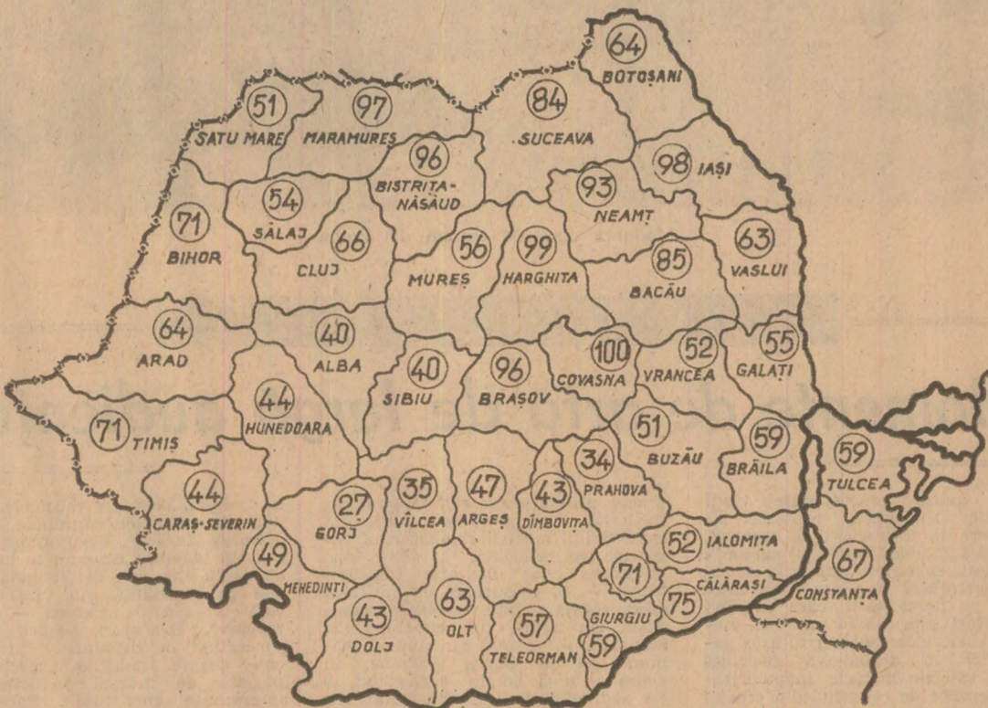
STADIUL ÎNSĂMÎNȚĂRII GRÂULUI, în procente pe județe, în seara zilei de 6 octombrie. (Date furnizate de Ministerul Agriculturii). (Ter. în județul Brașov s-a încheiat semănatul întregii suprafețe prevăzute cu cereale păioase.)