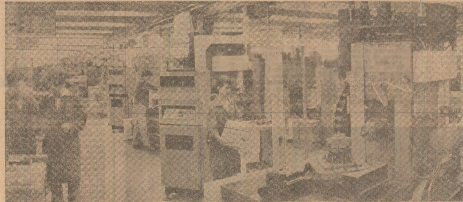
La Întreprinderea de echipament hidraulic din Rîmnicu Vîlcea