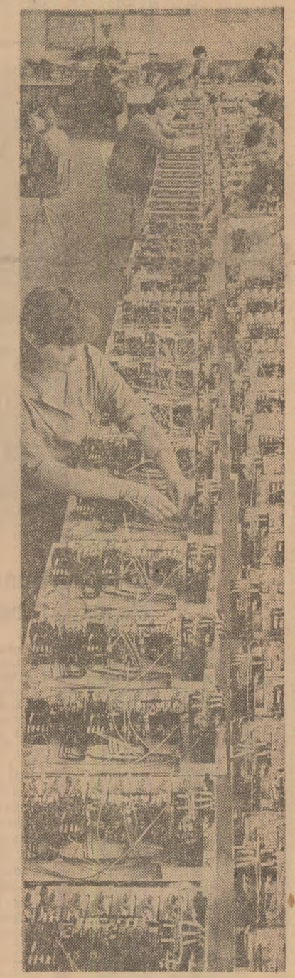
În cadrul întreprinderii de panouri electropneumatice din Bacău se finalizează un nou lot de echipamente electrice de comandă, destinate industriei construcției de mașini-unelte.

Prin balanțele materiale întocmite încă de la începutul anului s-au stabilit cu exactitate atât resursele materiale disponibile, cât și destinația precisă a fiecărui produs executat. Apare limpede deci importanța priorității din domeniul energetic, mineral, chimic și petrochimic, extractiv de titei. Numeroși specialiști, maeștrii și muncitorii din aceste sectoare de activitate au arătat că împlinirea marilor dificultăți în realizarea ritmică și la termen a unor utilaje și instalații din cauza lipsei țevilor. Industria noastră de profil dispune de suficiente capacități de producție pentru a realiza integral planul la producția de țevi. De se, totuși, se înregistrează rezerve foarte mari la producția de țevi? Ce măsuri se întreprind pentru recuperarea acestor rămășițe în urmă? Care sînt greutățile cu care se confruntă unitățile economice de profil?