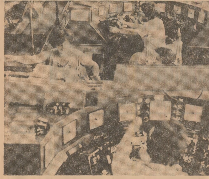
În secția relei termice din cadrul Întreprinderii de contactoare din Buzău se realizează o gamă largă de produse de înaltă calitate și fiabilitate, intens solicitate de sectoarele de vîrf ale economiei naționale.

Înnoirea și modernizarea producției — preocupare constantă a colectivului de muncă de la Întreprinderea de scule și elemente hidraulice Focșani — este marcată de noi realizări. Așa de exemplu, aici a fost lansată în fabricație freza tip FXK-300, pentru lucrarea arborilor cotiți. Noul produs caracterizat prin înaltă tehnicitate, asigură, totodată, triplarea productivității muncii. Este cel de al 8-lea tip de freză introdus în fabricație în cursul acestui an. A fost diversificată și gama tipodimensiunilor de mandrine, a dimensiunilor hidraulice, a altor scule și dispozitive, ponderea produselor noi și reproiectate reprezentând până acum aproape 35 la sută din totalul producției-marfa. De remarcat este și faptul că prin înnoirea producției și modernizarea tehnologiilor de fabricație, în timpul care a trecut din acest an s-a realizat și o economie importantă de metal. (Dan Drăgulescu).