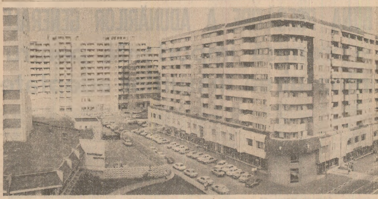
Bacău 1986 — un oraș ridicat pe verticala civilizației moderne.

Tovarășul Nicolae Ceaușescu și-a exprimat convingerea că România și Grecia vor colabora și mai activ în direcția dezarmării, soluționării problemelor din Balcani, pentru ca această regiune să devină o zonă a colaborării și păcii, fără arme nucleare și chimice.