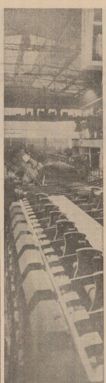
Dotarea cu utilaje moderne o întreprinderii de țevi fără sudură din Zalău asigură un înalt grad de mecanizare a producției