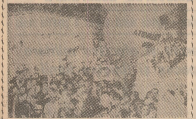
La Hunsrück (R.F.G.), 200 000 de militanți pentru pace au luat parte la o mare demonstrație împotriva instalării de rachete de croazieră la baza militară de la Hassebach