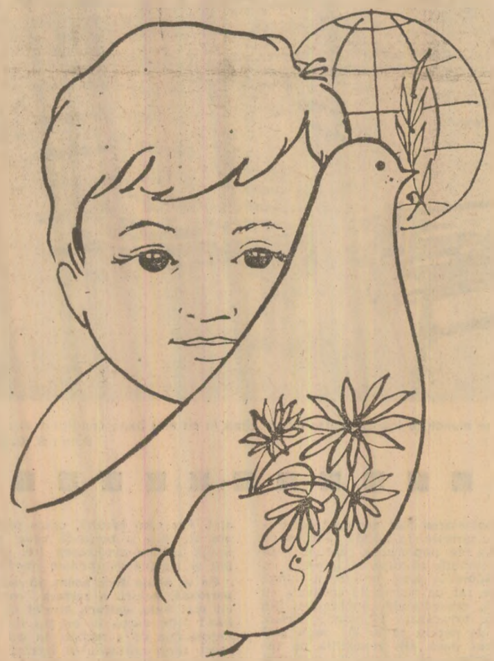
Desen de GH. CALĂRAȘU