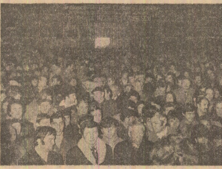
La întreprinderea „Mol” din Ploiești