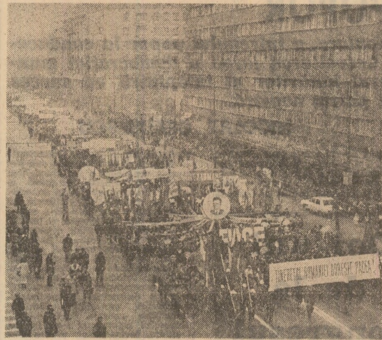
Un singur glas, o singură voință: Pace. Imagine de la grandioasa adunare populară, la care au fost prezenți 300 000 cetățeni din Capitală și reprezentanți din cele 40 de județe ale țării. (Fotografia din stânga); „Tineretul României dorește pacea!” — impresionantă manifestare a tinerilor generații din patria noastră pentru un viitor fără arme, fără războaie. (Fotografia din dreapta)