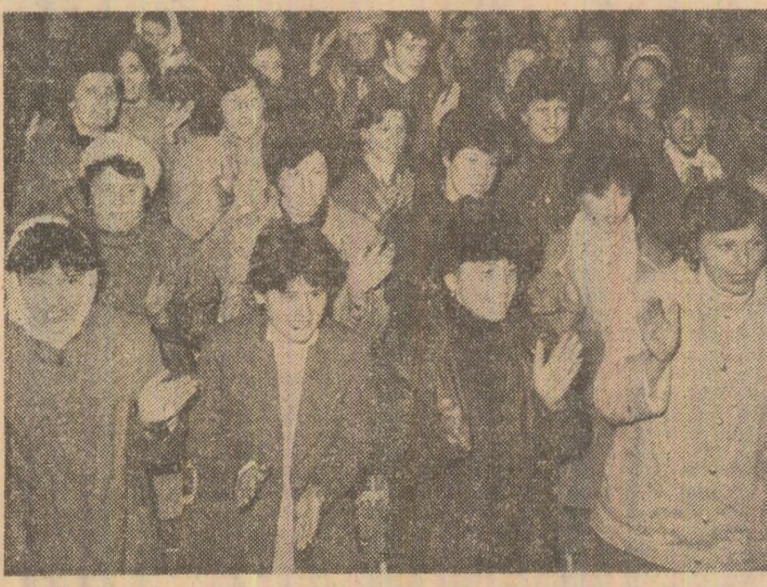
La Întreprinderea de confecții din Călărași