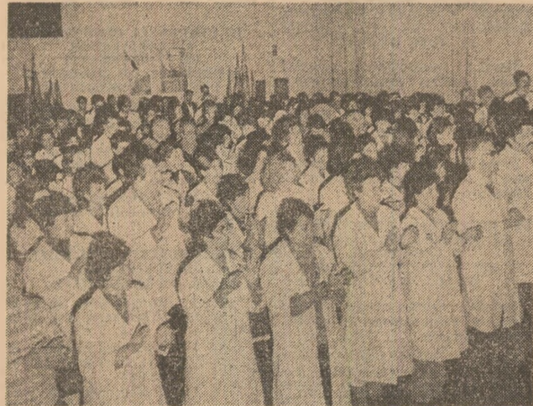
Adunarea oamenilor muncii de la Institutul de cercetări chimice din București