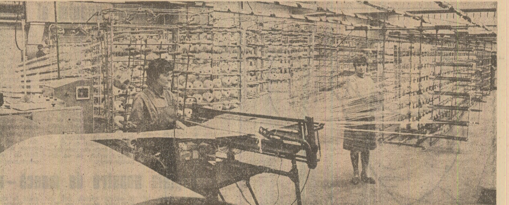
Acum, în ultima perioadă a anului, la întreprinderea integrată de din Zalău se munceste intens pentru îndeplinirea în cit mai bune condiții a sarcinilor de plan.

Situația în centrul preocupărilor înnoirea și ridicarea continuă a calității produselor, îndeplinirea ritmică a prevederilor contractuale cu partenerii de peste hotare, colectivele din 12 unități economice ale județului Vaslui au expediat la export de la începutul anului până acum, peste prevederi, produse în valoare de 71 milioane lei. Urmasrind zilnic modul în care se decurtea această activitate prioritară și livrind în avans cantități de produse, cu cele mai însemnate realizări se prezintă până acum colectivele întreprinderii de rumeli din Birlad și întreprinderii de materiale izolatoare din Vaslui. (Petru Neaul).