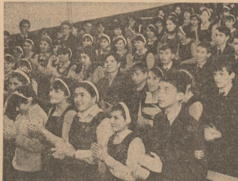
La Liceul de matematică-fizică numărul 1 din București