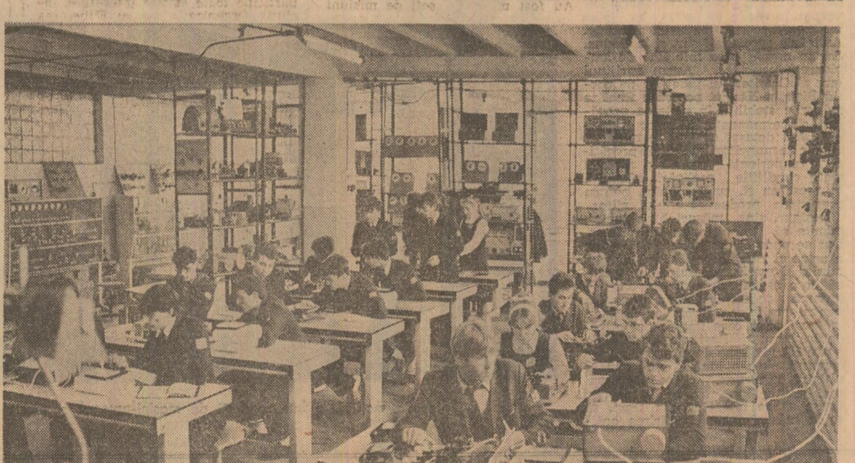
Lecție practică în laboratorul Liceului industrial „Electrocontact” din Botoșani

Vechea asezare românească, orașul Huși este atestat documentar în prima jumătate a secolului al XV-lea. Centrul a unei binecunoscută podgorii, el apare menționat la 1441 într-un registru al Universității Jagellone din Cracovia. Huși este o localitate se regăsește în lăzore interne. Hușiul devenise sub Ștefan cel Mare curte domnească. Vorbeste despre aceasta parțial domnia de țară și din nou cîntărea în 1494. Tirg pitoresc, cu oameni așezați și gospodării înfloritoare, orașul înconjurat de un amfiteatru natural avea să fie martor la un zăbucum istoric. La Sîrănești, pe Prut, în apropierea de Huși, Dimitrie Cantemir își vede într-o zi de julye III născuți speranți în libertate. Primul savant din sud-estul Europei devenit membru al unei academii străine, cea din Berlin, originar dintr-o familie de război în timpul Războiului, continua departe de țară o operă de falomăsoasă erudicție: Creșterea și deservirea. Imperiul otoman devenea cea mai celebră operă științifică a culturii române vechi, la fel cum celebrata umau să dobîndescă Descoperirea Moldovei și Hronul vechei a româno-moldo-vlahilor.