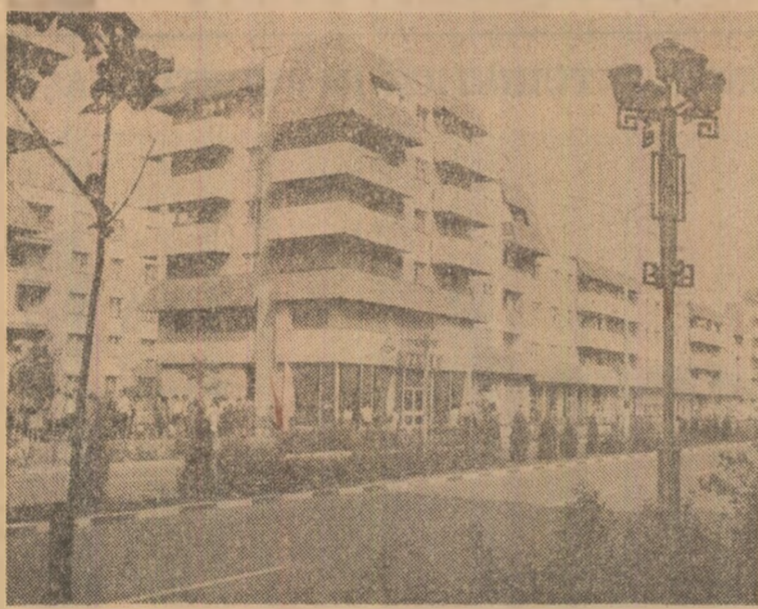
Tirgu Neamț: Fostul tirg a devenit un oraș modern

localităților patriei. Orașul este nou de la un capăt la altul, cu o arhitectură specifică, împlînd noutatea conștințelor cu nota tradițională. S-au construit peste 2 500 de apartamente pentru cetățenii orașului, o policlinică nouă, un nou cinematograful, două complexe meșteșugărești, două unități hoteliere, a fost pusă în funcțiune o centrală telefonică... De altfel, să știți, pînă la Congresul al IX-lea al partidului, orașul nostru nu era decît un sat mai răsunător. Între-adevăr. Nu aflai aici decît un sat mai mare, cu pretenții de „tirg”. Numele era, pentru vremea aceea, marca orgoliului. De atunci, lucrurile s-au schimbat; în cele două decenii de istorie nouă, în viața orașului și-a făcut loc, cu putere, industria. Multe întreprinderi, între care fabrica de volvatir, fabrica de mobilă, cea de furnituri sau aceea de panouri, complexul de prelucrare a legumelor și fructelor, alte unități industriale concentrează un număr de lucrători ce egalează numărul locuitorilor orașului de acum 20 de ani. Între timp, populația orașului a depășit cifra de 20 000. O populație tinăra — media de vîrstă abia depășește 20 de ani — într-un tînar oraș, cu mulți copii și cu multe flori. Semn că-și iubesc orașul, gospodarii din Tirgu Neamț, iubitori de frumos,