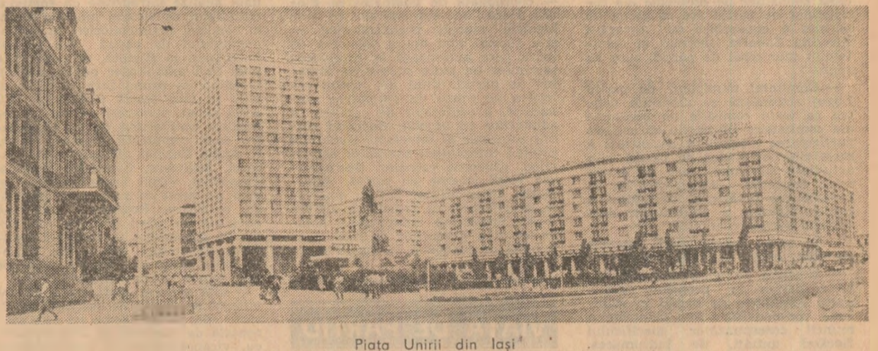
Plata Unirii din Iași