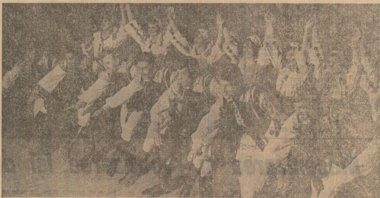
Grăție, tinerete, măiestrie! Sînt argumentele artiștilor amatori din formația de dansuri populare a Casei de cultură a sindicatelor din Botoșani

Rezultatele bune obținute de formațiile artistice și creatorii de la C.I.C. „Azomures”, I.P.C. „23 August”, „Electromures”, „Nicolae Bălcescu”, Fabrica de sticlărie și falezărie Sighișoara, I.M. „Republica”, I.U.P.S., I.P.M. Sport (Reghin), Combinatul chimic, Fabrica de gazeuri din Tîrnăveni, indică un potențial creator cu mult mai mare față de numărul de formații de care-l au și care este departe de a fi reprezentativ pentru tabloul de prestigiu a acestor puterice colective muncitorești. În aceeași măsură, în comune ca Gurguiu, Ațintis, Miheșu de Cîmpie, Vinători, Nades, Brîncovenesti, Sînpetru de Cîmpie, deși există forte