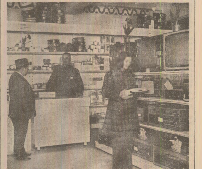
Magazinele Cooperatei de Producție, Achiziții și Desfacere a Mărfurilor din toată țara, bine aprovizionate pentru această perioadă, oferă în „Luna cadourilor” un variat sortiment de produse: confecții și tricotate; încălțăminte, articole de galanterie și marochinărie; articole electrotehnice și de uz casnic; jocuri logice și distractive, jucării pentru copii.