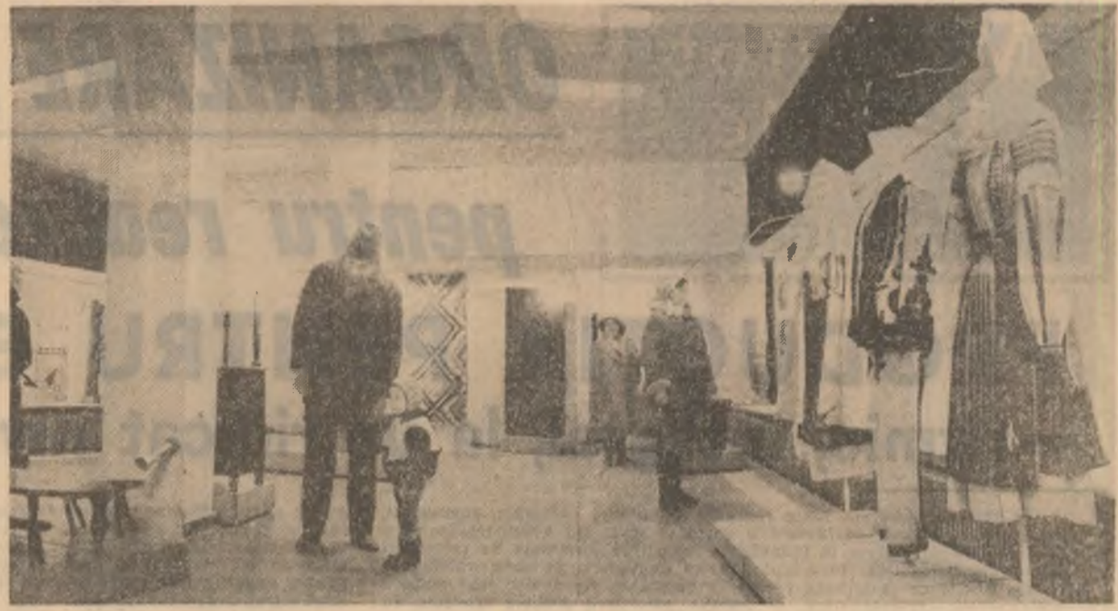
In cadrul Muzeului satului și de artă populară din Capitală se află deschisă expoziția "Runcu — un sat din Gorji". Această veche așezare târîneasă pe care un hrîsov domnesc o semnalează încă din anul 1488, situată la 15 km nord de orasul Tr. Jiu, este reprezentativă pentru zona etnografică a văilor Sohodolului și Jaleului. Bozatele sale elemente de artă populară și folclor devin subiecte de amănunțite cercetări și studii monografice. Expoziția reunește...