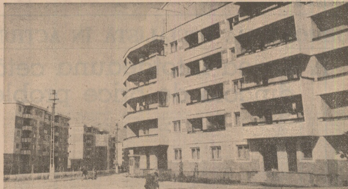
Sighetu Marmației — un oraș în plină dezvoltare