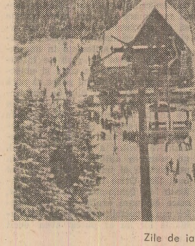
Zile de iarnă la Păltiniș.

șase puncte (bd. 1 Mai nr. 168, Bujoreni, Polizu nr. 20, Piața Ortodoxă nr. 307, șos. Chitilei nr. 219), fără a reuși însă să stăm de vorbă cu vreun gestionar sau achizitor. În schimb l-am găsit pe directorul adunat al Întreprinderii de recuperare și valorificare a materialelor refolabile, tovarășul Anton Peagu, căruia i-am relatat sesizările cetățenilor și propriile noastre observații. Deocul surprins, interlocutorul ne-a asigurat că nu l-am spus nici o noutate: „Aspectele sesizate le cunoaștem”. — Si ce faceți pentru eliminarea lor? — Tipărim afișe prin care explicăm cetățenilor ce importanță are colectarea materialelor refolabile. — Incît, deși răspunsul se refera la afișe, am rămas... tablou.