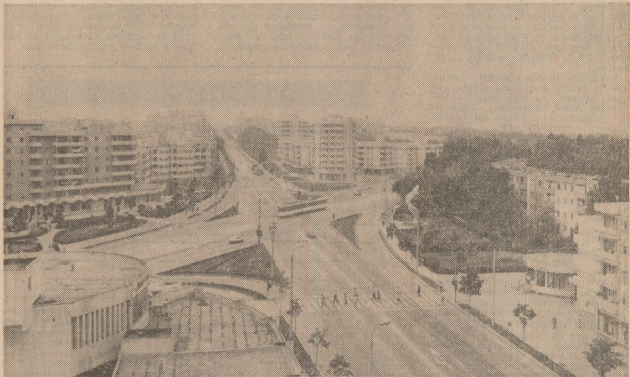
Din noul peisaj al Constanței

al Regatului Suediei în țara noastră. (Continuare în pagina a V-a).