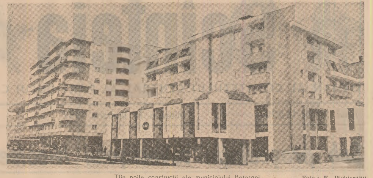
Din noile construcții ale municipiului Botoșani