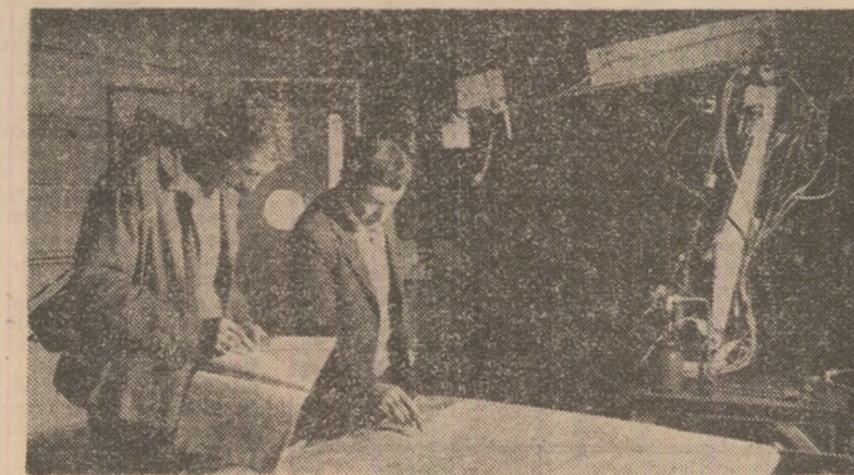
Întreprinderea „Semănătoarea” din București. În pregătire — introducerea de roboți și manipulatori în procesele de prelucrare mecanică și la vopșire