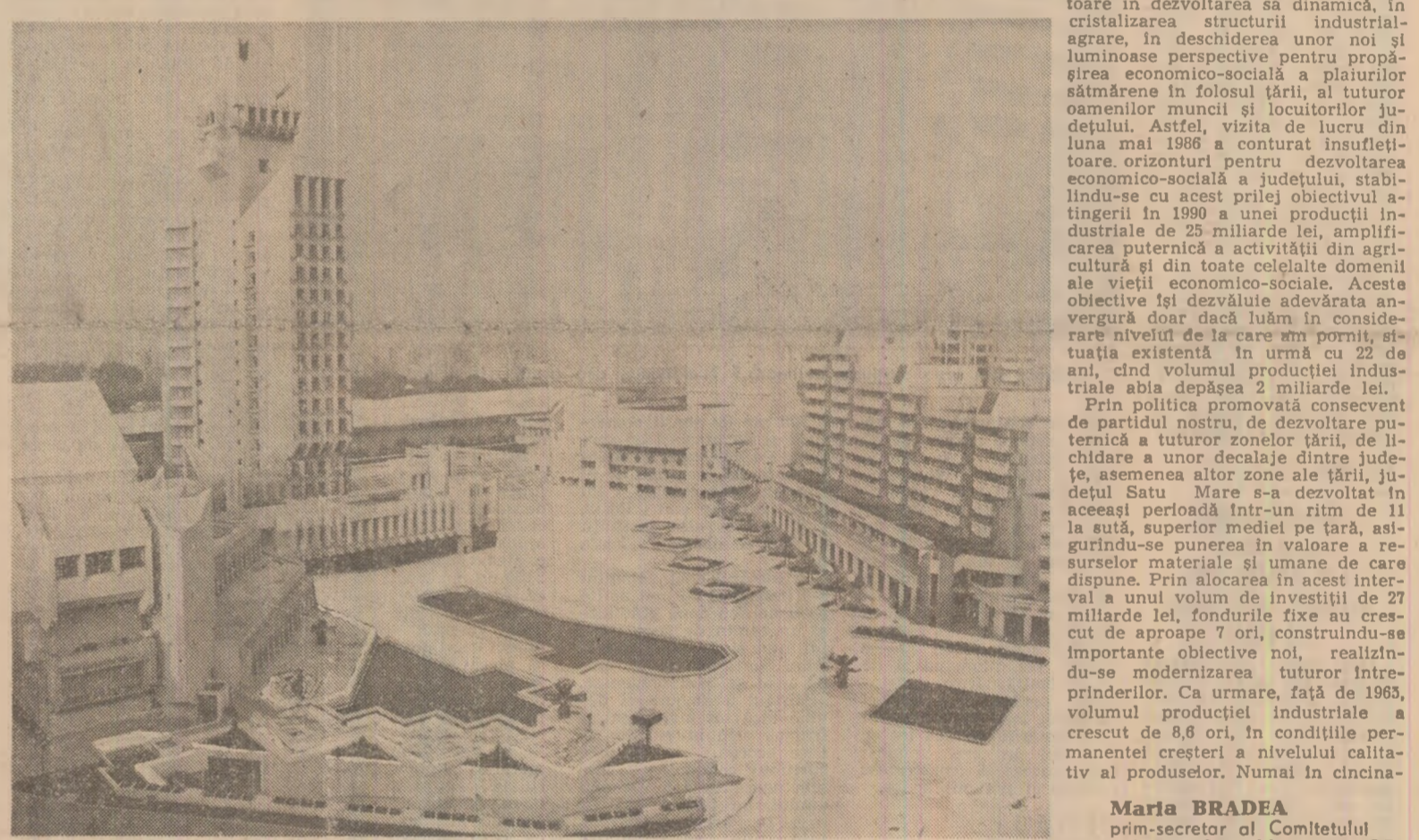
Zona centrală a municipiului Satu Mare — o imagine dintre altele, vorbind despre mărețe împliniri socialiste

de semnificații economice și social-politice, ce în de însăși esența