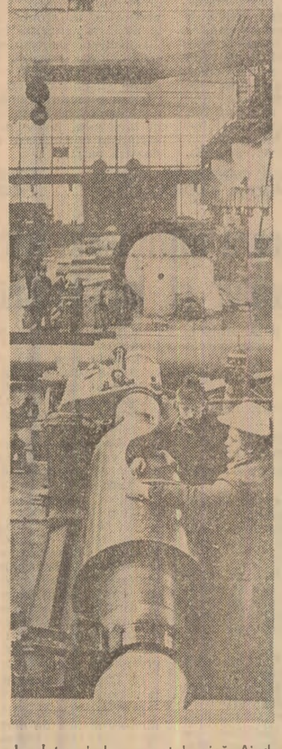
La întreprinderea metalurgică Aiud, în secția prelucrării mecanice se realizează o gamă largă de cilindri de laminare pentru combinatelor siderurgice.

DIN ACTUALITATEA SOCIALISTĂ A ȚĂRII ● reportaje ● însemnări ●