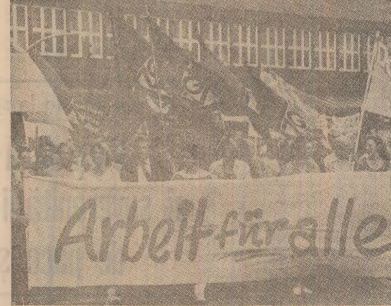
„Locuri de muncă pentru toți!”. Sub această lozincă, mii și mii de persoane au organizat o puternică demonstrație la Augsburg — în R.F. Germania, unde procentul șomajului este deosebit de ridicat — cerind asigurarea dreptului la muncă

viată decentă, la asigurarea sănătății, la asigurarea profesională sau facultăților, funcționării și personalității în toate domeniile. Prezențe permanente în fața oficiilor de plasare sînt chiar mici comercianți și meseriași partuculari, care au dat faliment, avocați, medici, cadre didactice, pentru care găsirea unui loc de muncă, potrivit calificării și specializării lor, este o preocupare de zi cu zi.