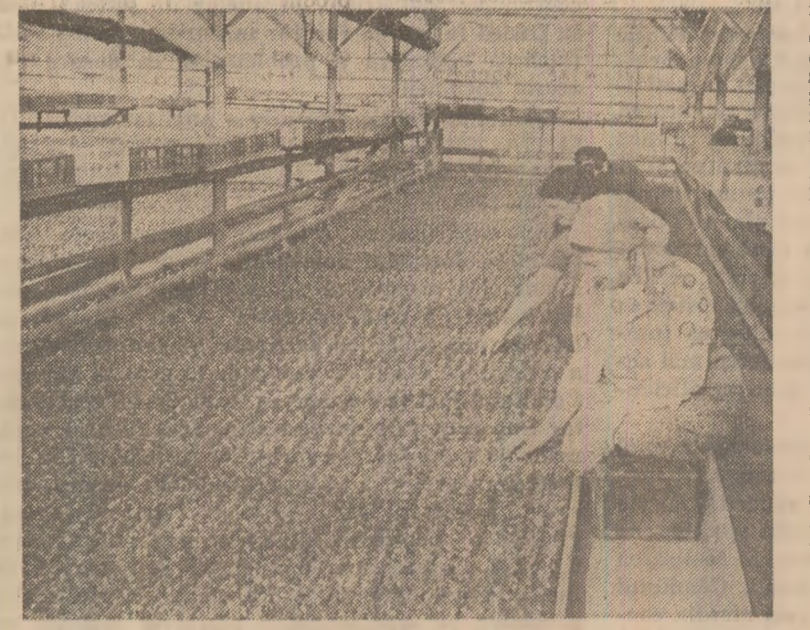
La C.A.P. Jilava, sectorul agricol Ilfov, au fost repicate în cuburi nutritive 100000 fire de rîsad de vorz

La veniturilor. Procedîndu-se astfel, nu numai în cadrul acestei adunări de bilanț, ci și pe parcursul desfășurării procesului de producție, s-a reușit atragerea mai largă și mai activă a oamenilor la actul de decizie și, concomitent, s-a înțesat răspunderea pentru îndeplinirea a tot ceea ce s-a propus în plan. Ne vom opri, în rîndurile ce urmează, asupra unui singur aspect: activitatea din legumicultură. Și nu întîmplător, C.A.P. Jilava va cultiva în acest an 300 hectare cu legume de pe care urmează să realizeze o producție de 6900 tone. Pentru a realiza și depăși această producție, alți darea de seamă, cît și cei care au luat cuvîntul au arătat că, în mod obligatoriu, trebuie înlăturată neajunsurile manifestate anul trecut în activitatea unor formații de muncă. În acest sens, s-a dat ca exemplu, nivelul producției și al veniturilor din cele două ferme legumicole. Ferma nr. 1 a realizat o producție de 3693 tone legume, depășind planul cu 4 la sută, iar ferma nr. 2 — 2810 tone. Valoarea producției realizate diferă și ea: s-a depășit cu 39 la sută la ferma nr. 1 și cu numai 12 la sută la ferma nr. 2. Deși rezultatele din legumicultură ar putea onora pe mulți legumicultori din alte unități agricole, aici,