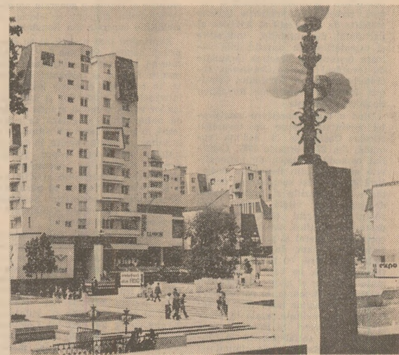
Dovadă concludentă a preocupării conștente a partidului și statului nostru privind dezvoltarea armonioasă a tuturor zonelor țării și inițierea de toate planurile din județul Vaslui, unde procesul de modernizare economică a fost însoțit de un mare program de investiții edilitare. În imagine: noi blocuri de locuințe din municipiul Tg. Mureș.

La întreprinderea Laminorul de tablă Galați a intrat în funcțiune o modernă instalație de zincare a tablilor prin procedeu electrolitic. Noua instalație a fost realizată prin contribuția deosebită a Institutului de cercetare și proiectare de specialitate din Galați: a antrepriezei de construcții industriale și a colectivului întreprinderii mecanice navale. Este de rețut faptul că, față de procedeu clasic de zincare, crește considerabil productivitatea muncii prin înaltul grad de automatizare, reducându-se de circa șase ori consumul de zinc. (Stefan Dimitriu).