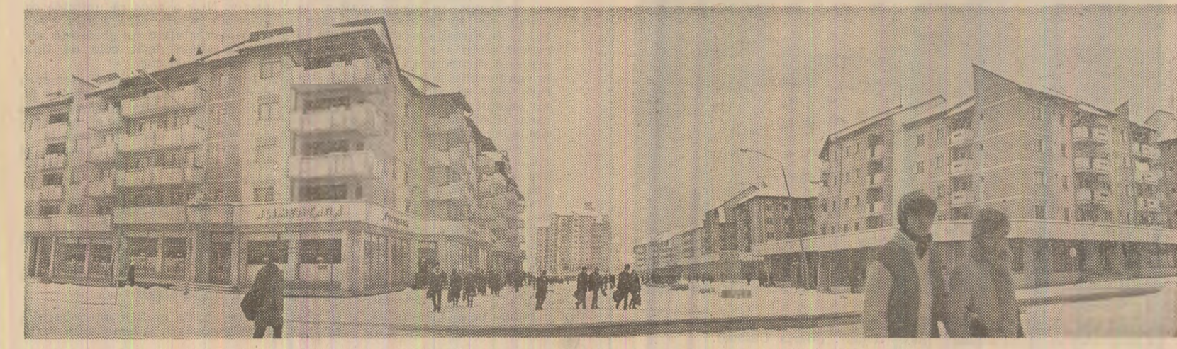
Construcții noi, moderne, în municipiul Petroșani

Mihai CARANFIL (Continuare în pag. a V-a)