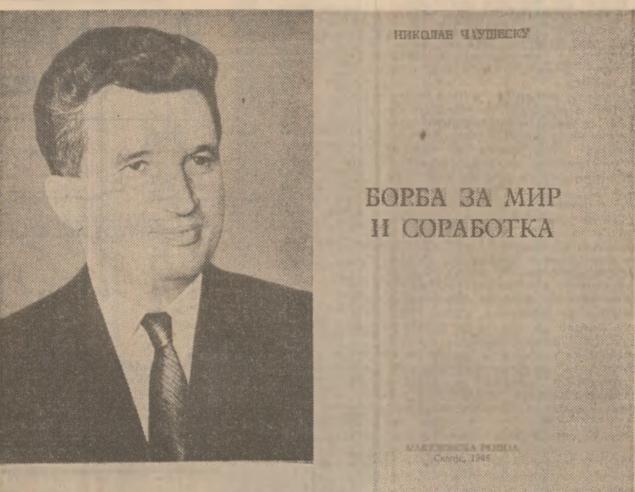
BOBNA ZA MIR I I CORABOTKA

Pornind de la aceste realități, România, președintele Nicolae Ceaușescu se pronunță pentru participarea tuturor popoarelor și forțelor democratice în vederea realizării dezarmării. Președintele Nicolae Ceaușescu — a spus vorbitorul — și-a făcut auzit glasul pentru realizarea unei mari înțelegeri, pentru a se pune capăt acestor curse periculoase. În acest sens, a propus, ca alternativă posibilă, înlocuirea curselor înarmărilor cu o întrecere pașnică a valorilor creatoare, spirituale ale popoarelor din întreaga lume. Chiar și în condițiile actualei vieți internaționale complicate, președintele Nicolae Ceaușescu privește cu evident optimism dezvoltarea relațiilor internaționale și, de aceea, luptă