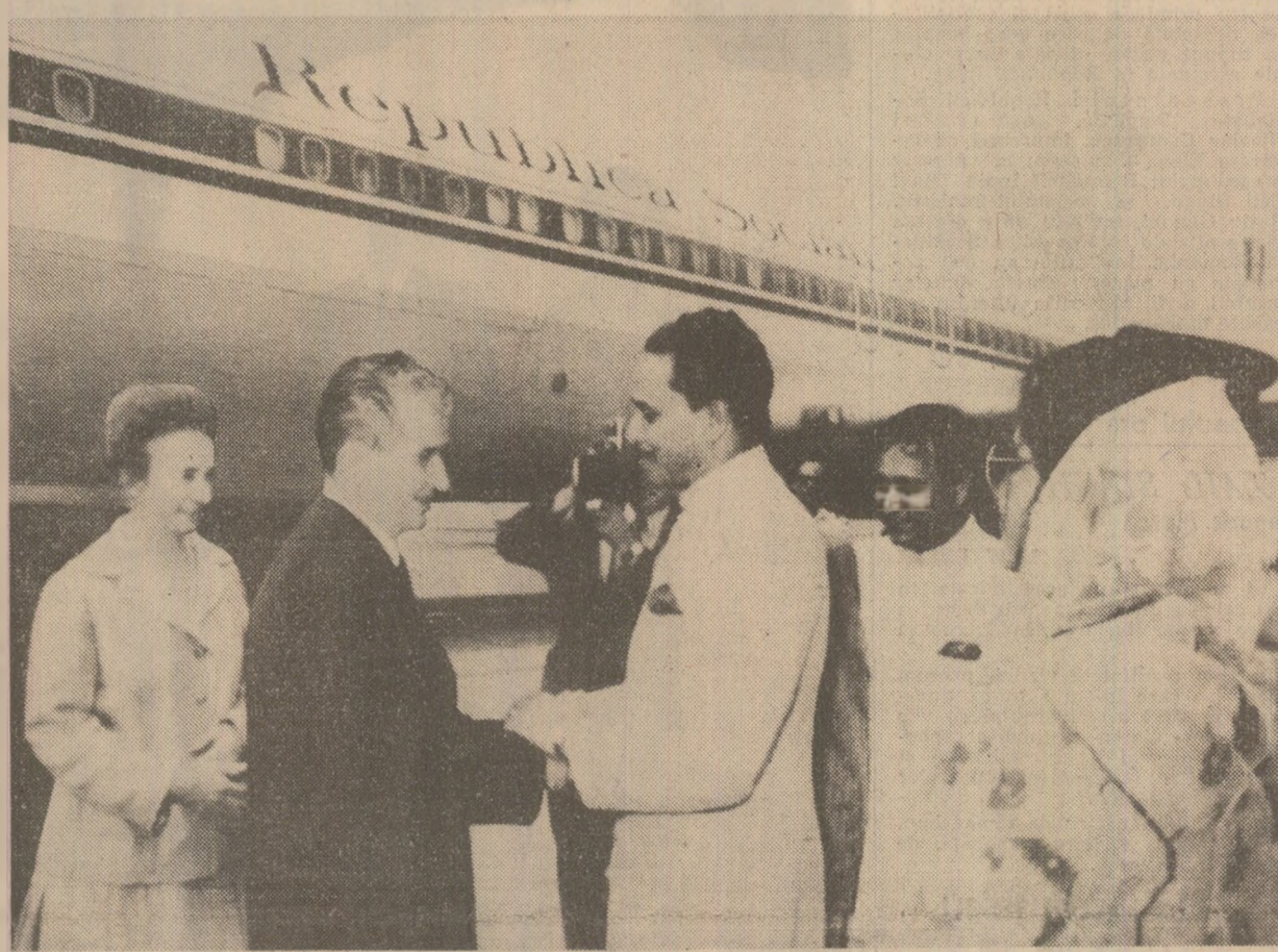
Președintele Nicolae Ceaușescu și tovarășa Elena Ceaușescu s-au întilnit cu președintele Hussain Mohammad Ershad și doamna Raushan Ershad

Președintele Republicii Socialiste România, tovarășul Nicolae Ceaușescu, și tovarășa Elena Ceaușescu s-au întilnit, joi după-amiază, cu președintele Republicii Populare Bangladesh,