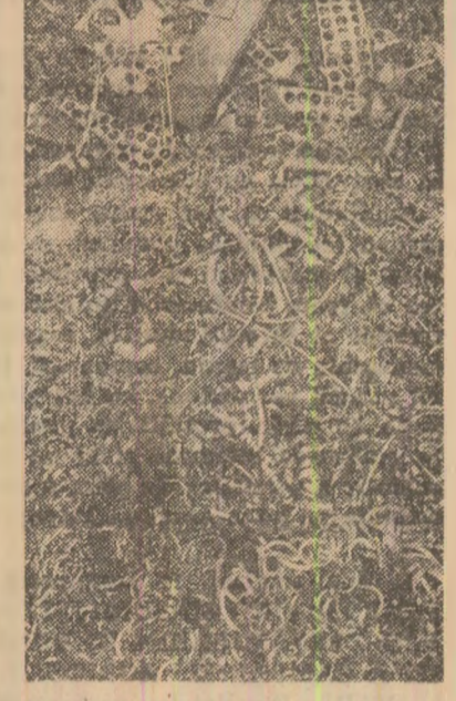
La gospodăria de metal a întreprinderii, în boxa special amenajată și în care ar trebui să fie depozitat numai șpan de bronz, se găsește amestecate bucăți de bronz, straiuri de cupru, benzi, sîrme și bucăți de alamă, toate ce-l drept metale neferoase, dar care nu au ce căuta împreună.