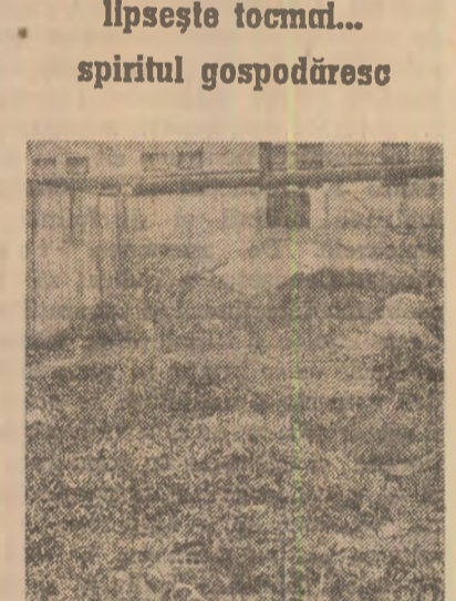
Iată un exemplu, dintre multe altele, care ilustrează deficiențele existente la Întreprinderea mecanică din Roman în activitatea de recuperare și valorificare a metalelor. Unele deficiențe pot apărea ca „minori” la prima vedere, dar au în realitate consecințe grave. Iată în secția mecanică ușoară, într-un conținer neetichetat au „usual” semifabricate turnate, o freză cu plăcuțe vidia, piese forjate, buce de cupru, un platon de la o mașină-unelte, altele și multe altele sortimente de metal, deci piese cu compoziții diferite, ceea ce provoacă mari neajunsuri la valorificarea lor.