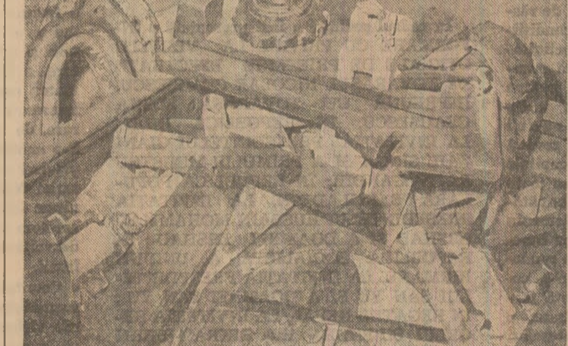
Iată un exemplu, dintre multe altele, care ilustrează deficiențele existente la Întreprinderea mecanică din Roman în activitatea de recuperare și valorificare a metalelor. Unele deficiențe pot apărea ca „minori” la prima vedere, dar au în realitate consecințe grave. Iată în secția mecanică ușoară, într-un conținer neetichetat au „usual” semifabricate turnate, o freză cu plăcuțe vidia, piese forjate, buce de cupru, un platon de la o mașină-unelte, altele și multe altele sortimente de metal, deci piese cu compoziții diferite, ceea ce provoacă mari neajunsuri la valorificarea lor.