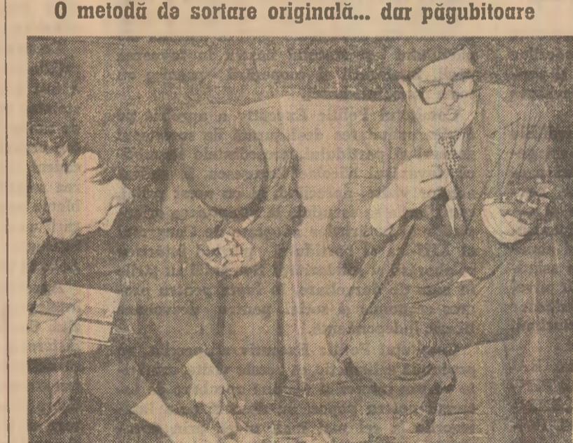
Burghie, flanse, capete de bară, otel pătrat și hexagonal, leavă și garnituri. În plus, un număr însemnat de cuțite de strung — iată ce se găsește într-un conținer din secția scolarie. O dovadă de neîndreptare, o încălcare a celor mai elementare norme de sortare, de recuperare și valorificare a materialelor refolosibile.