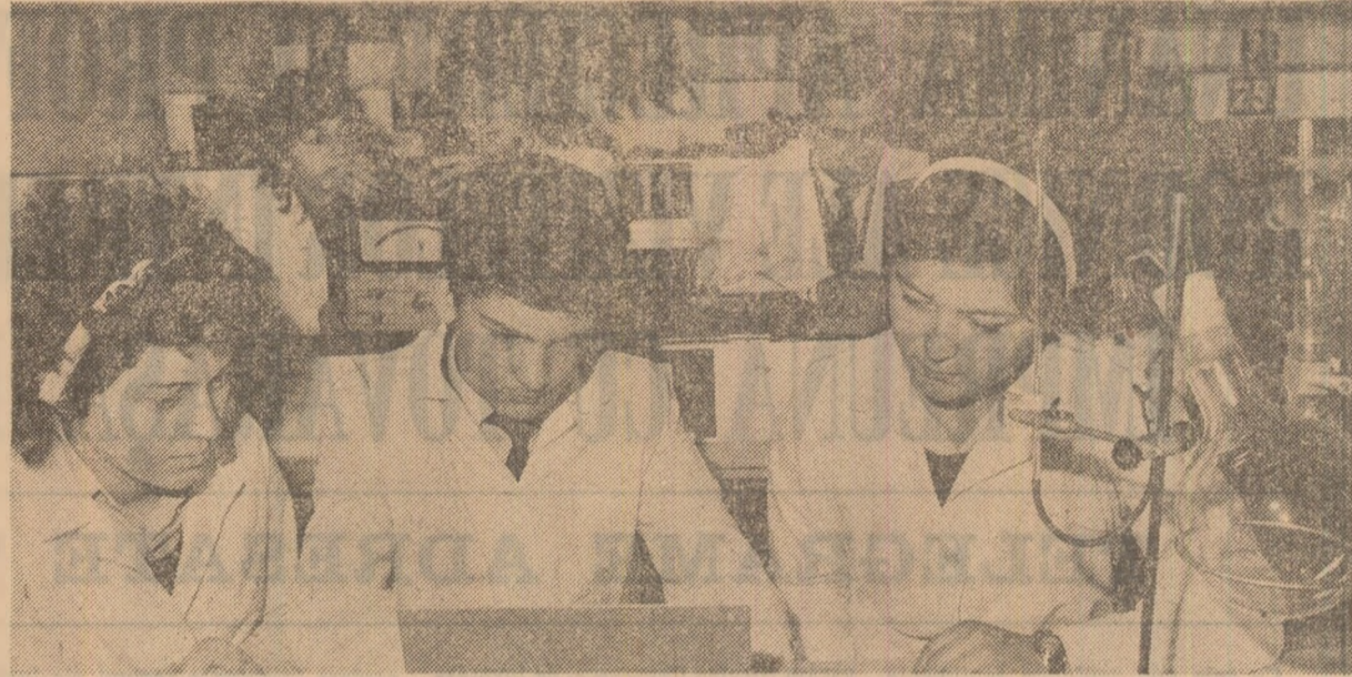
Liceul de matematică-fizică nr. 1 din București