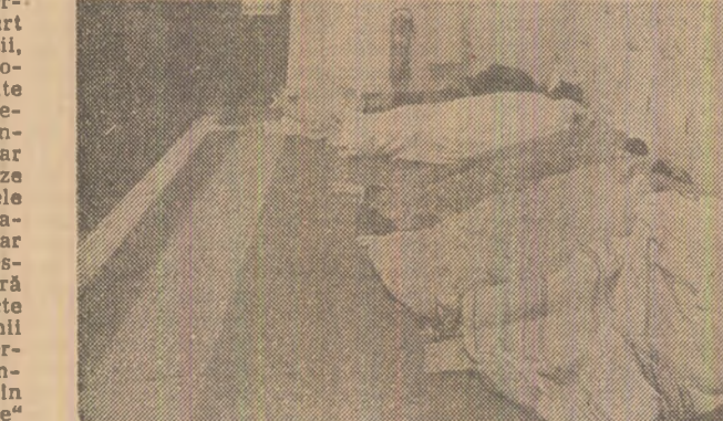
„Austerlitz” și „Saint Michel” — două dintre stațiile metroului din Paris deschise și peste noapte pentru a-i „găzdui” pe cei fără adăpost