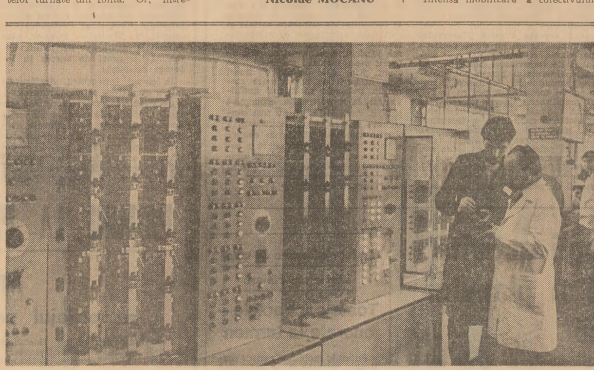
La întreprinderea „Electroaparataj” din Capitală se probează un nou lot de produse care urmează să fie livrate beneficiarilor.

La întreprinderea „Electroaparataj” din Capitală se probează un nou lot de produse care urmează să fie livrate beneficiarilor