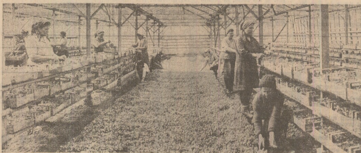
În sara C.A.P. Grușu se pregătesc răsăduirile pentru a fi scoase în cîmp