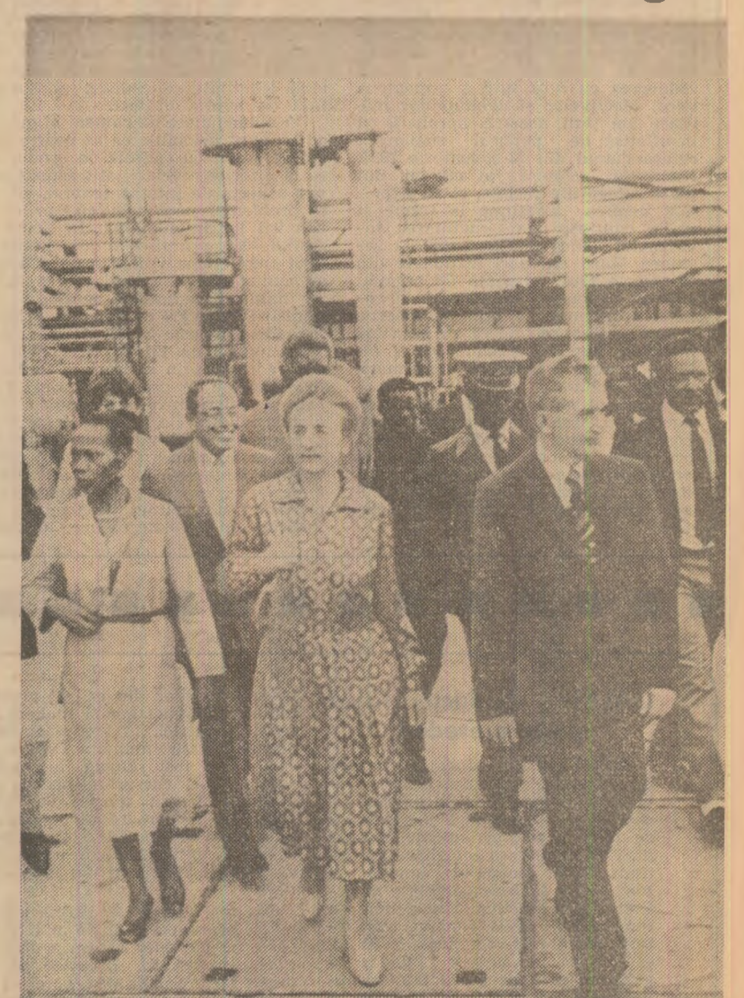
cadrelor angoleze care lucrează la această rafinărie.

Înfrîșind eforturile depuse pentru obținerea acestor rezultate, gazdele au ținut să adreseze calde mulțumiri pentru ajutorul acordat de România în formarea și pregătirea