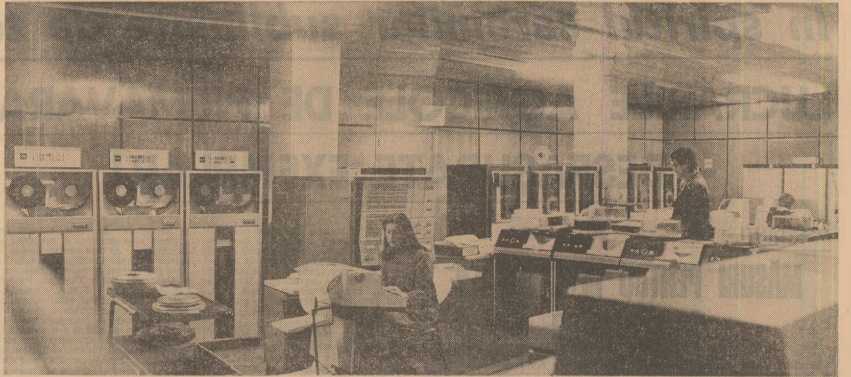
Oficiul de calcul al întreprinderii „Tractorul” din Brașov