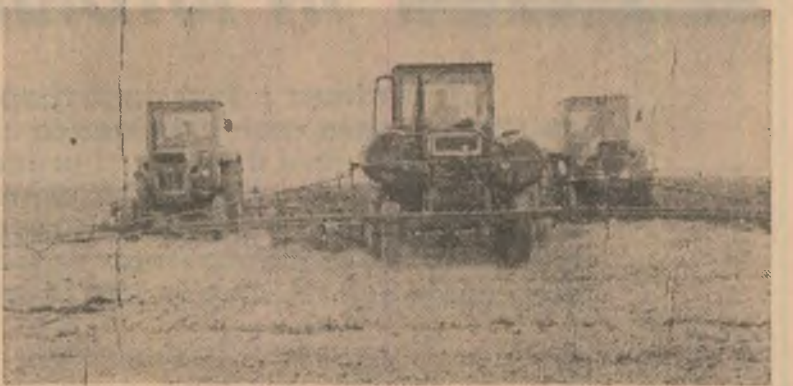
Erbicidarea terenului la C.A.P. Frasinu, județul Giurgiu