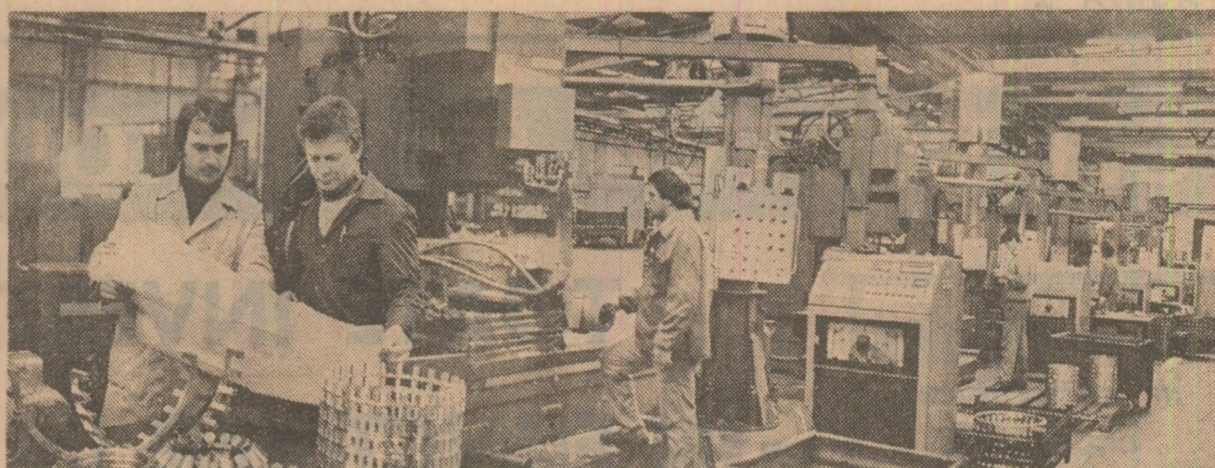
Aspect de la Întreprinderea de rulmenți grei din Ploiești

Anul LVI Nr. 13 883 Vineri 10 aprilie 1987 Prima ediție 6 PAGINI — 50 BANI