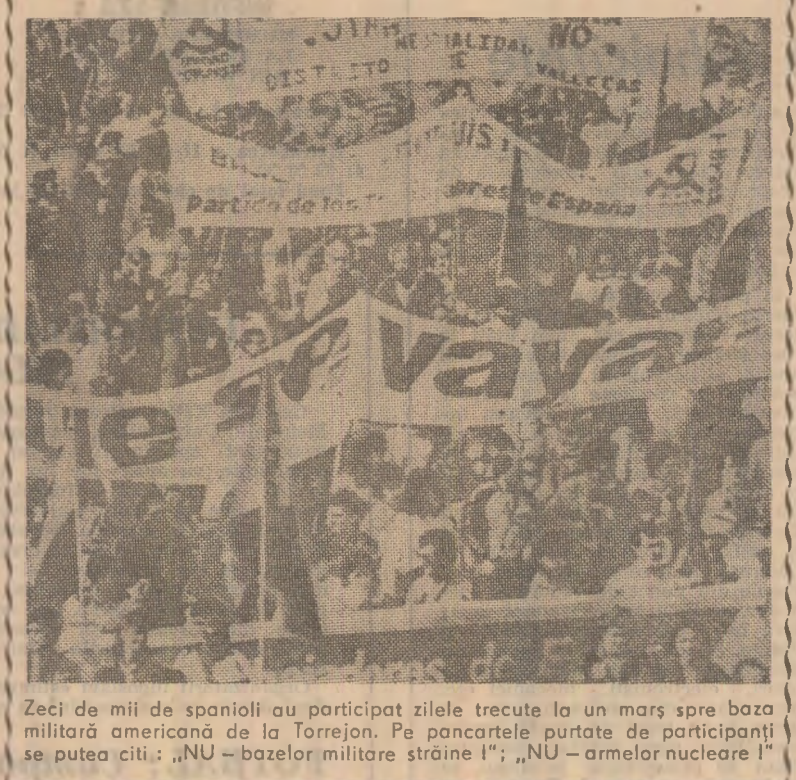
Zeci de mii de spanioli au participat zilele trecute la un marș spre baza militară americană de la Torrejon. Pe pancartele purtate de participanți se putea citi: "NU — bazelor militare străine!", "NU — armelor nucleare!"

ROMA 10 (Agerpres). — Criza guvernamentală din Italia a înregistrat un nou moment decisiv. Impopularitatea partidului democrat-cristian și socialist de a conduce guvernul.