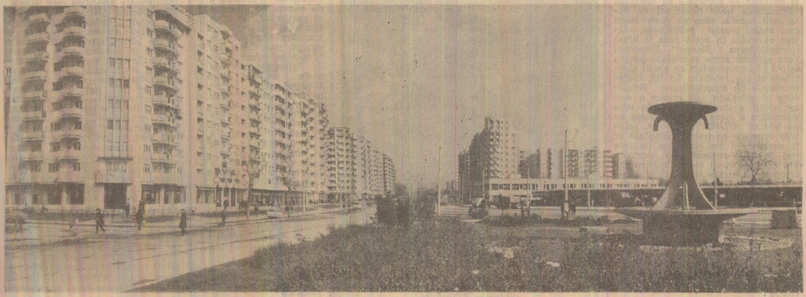
Din noul peisaj al Capitalei : Piața Crîngăși