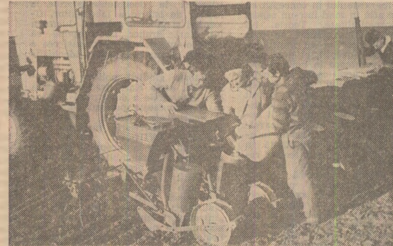
Semănatul porumbului la C.A.P. „Viata Nouă” — Brastavatu.

Pe parcursul documentării noastre am înregistrat multe alte fapte de muncă, pe care doar din lipsă de spațiu nu le putem relata pe larg. A început erbidarea cerealelor plouate, lucrare ce nu suferă o amînire, se fac pregătiri intense pentru declanșarea la momentul oportun a țirgărilor culturilor, continuă plantarea legumelor etc. Toate acestea dau trîmnic angajamentului oamenilor muncii din agricultura județului Olt de a face cea mai scurtă campanie de înmîmări și de a obține producții mari, care să onoreze titlul de „Erou al Noi Recoltelor”.