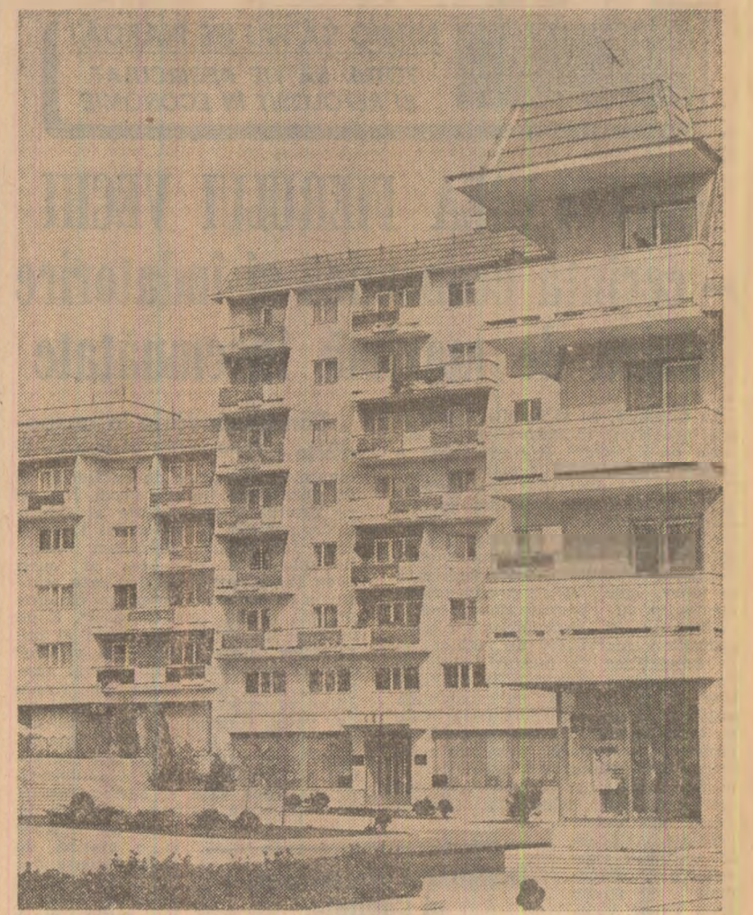
Din noua arhitectură a municipiului Sîntu Gheorghe

A fost exprimată dorința de a se acționa și în vîltoare pentru întărirea concilierii dintre România și Malta, atît pe plan bilateral, cît și pe arena internațională, în interesul reciproci al cauzei generale a păcii și securității în Europa și în lume.