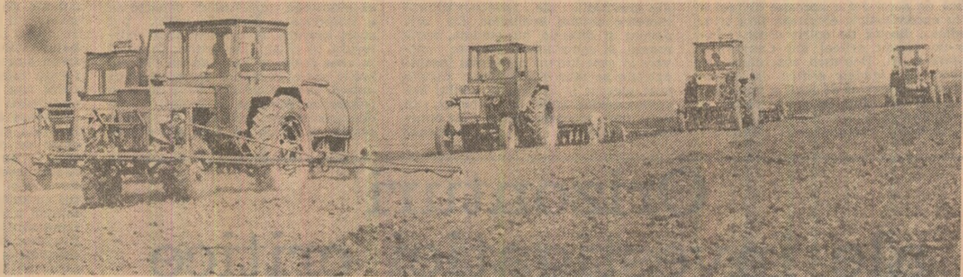
Pregătirea terenului la C.A.P. Lungulețu, județul Dimbovița

...TRUSTUL HORTICOL DIN JUDEȚUL PRAHOVA. Activitatea intensă a cooperativelor din Dumbrăvești, județul Prahova, a fost stopată la un moment dat. Motivul? Lipsa cartofilor de sămînță. Este de dorit ca trustul horticol județean să ia grabnice măsuri pentru a asigura întreg necesarul de cartofi de sămînță, cunoscut fiind faptul că orice întirziere la plantat diminuează mult producția. (Ioan Marinescu).