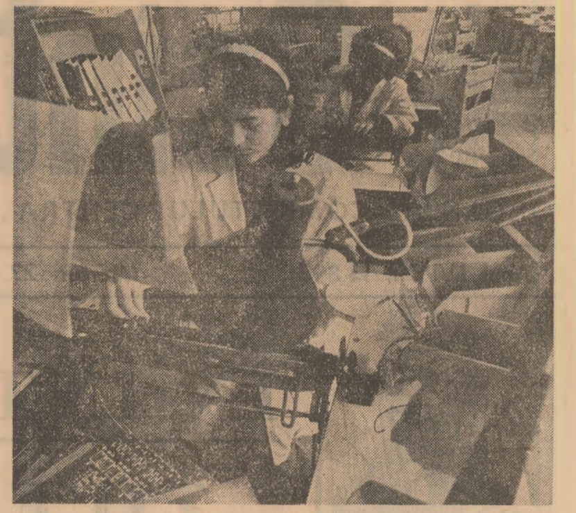
În secția centrale automate electrice a întreprinderii „Electromagnetica” din Capitală

Ioan MARINESCU Nicolae SANDRU corepondenți „Scintei”